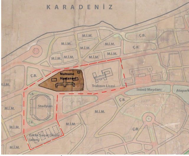
Şekil 6. Kavakmeydanı'ndaki (İnönü Meydanı) Numune Hastanesi'nin Lambert planı içindeki konumu 27