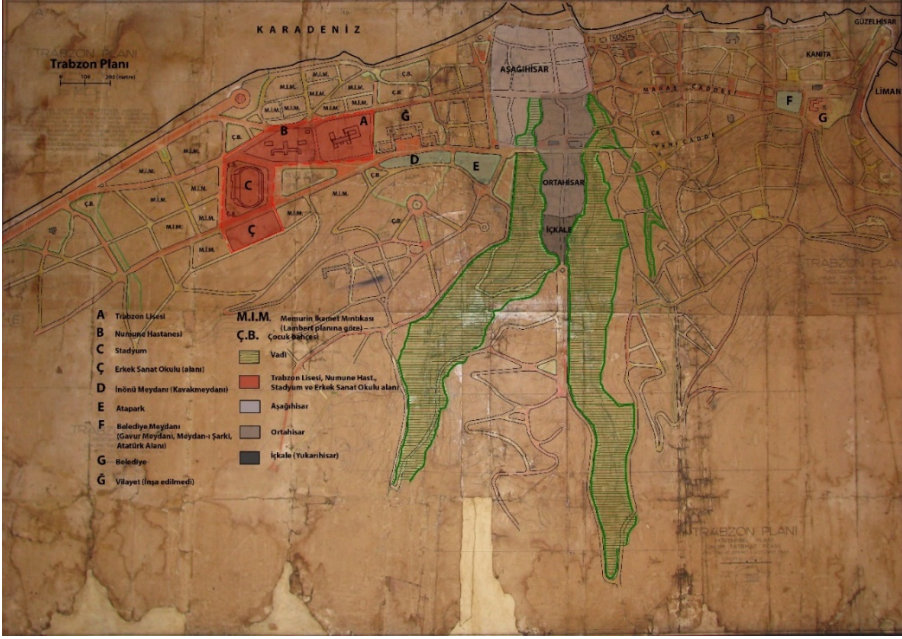
Şekil 1. 1/2000 ölçekli Lambert planında Trabzon Lisesi, Numune Hastanesi, Stadyum ve Erkek Sanat Okulu yerleşim alanı 19 (Lambert, 1937a).

sayfalık 1/2000 ölçekli plân, 17 sayfalık 1/1000 ölçekli avan proje hazırlanmıştır (Şekil 1).