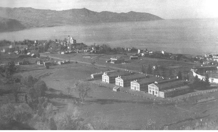
Şekil 11. Erkek Sanat Okulu.

Erkek Sanat Okulu, 1951'de eski Ticaret Mektebi'nden yeni binasına taşınır (Halk, 1951). En büyük sorun ise, Numune Hastanesi, Trabzon Lisesi gibi yeni yapıların da inşa edildiği şehrin bu bölümünde, altyapı çalışmalarının henüz gerçekleştirilmemiş olmasıdır. 1946 yıllarına kadar şehrin batı bölümünde inşa edilen Numune Hastanesi'nin yolu, Erkek Sanat Okulu'nun yolu ve kanalizasyon tesisatı bulunmamaktadır (Halk 1946). Halk gazetesine göre, bu dönemde Erkek Sanat Okulu'nun önünden geçen yol, bir balçık deryasını andırmaktadır (Halk, 1947d).