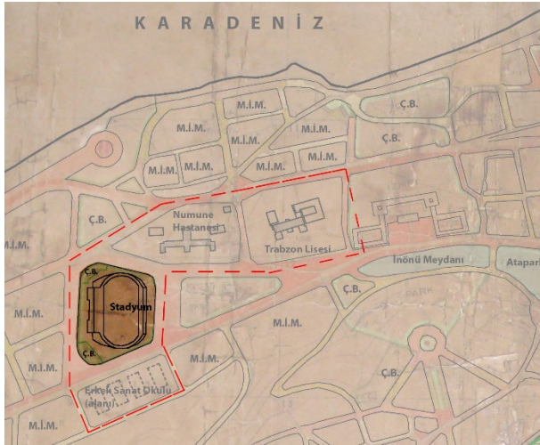
Şekil 8. Kavakmeydanı'ndaki (İnönü Meydanı) Stadyum'un Lambert planı içindeki konumu 29