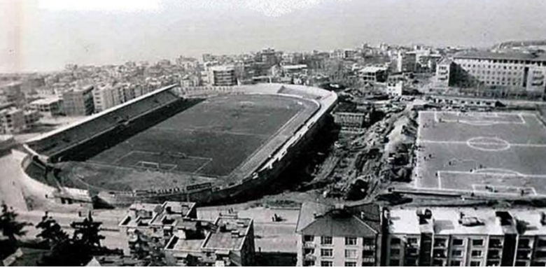
Şekil 9. Stadyum (Trabzon Kanuni Eğitim ve Araştırma Hastanesi arşivi, 2021, 15 Nisan)