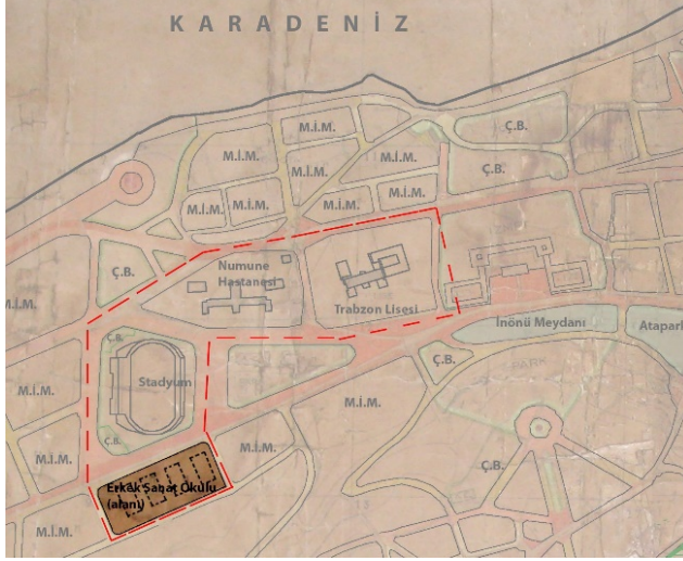
Şekil 8. Kavakmeydanı'ndaki (İnönü Meydanı) Erkek Sanat Okulu'nun Lambert planı içindeki konumu 30

ihalesini, Ankara'dan, üç ortak müteahhitin aldığı ile ilgili haberler bulunmaktadır (Halk, 1945f; 1945g).