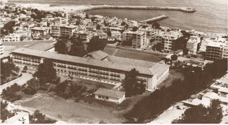
Şekil 5. Trabzon Lisesi (Trabzon Kanuni Eğitim ve Araştırma Hastanesi arşivi, 2021, 15 Nisan)

Taut'un , binanın yapımını takip eden süreç içinde bahçedeki manzara etkisinin kaybolmaması ve denizden gelen serin hava ve rüzgârın okul bahçesine her daim alınabilmesi amacıyla, Maraş Caddesi üzerinde bulunan arsanın istimplâki için Maarif Vekâleti'ne yaptığı ısrarlı talep sonucunda, bu alan da istimplâk edilerek okul sahası içine alınmıştır (Albayrak, 2008, s. 205). Burada dört adet tarihi çınar ağacı bulunmaktadır. Taut, inşaat alanı henüz kurulurken, burada bulunan manolya ağacının kesilmemesi amacıyla okulun temelini kuzeye kaydırmış olması dolayısıyla, Lise burada bulunana tarihi manolya ağacıyla anılır (Albayrak, 2008, s. 205).