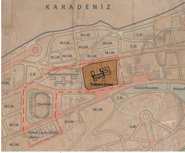
Şekil 4. Kavakmeydanı'ndaki (Inönü Meydanı) Trabzon Lisesi'nin Lambert planı içindeki konumu 24

1945 tarihli Halk gazetesinde “Memleketin imarı için konan her taş kaledir.” denilmektedir (Halk, 1945a). Yeni lise, şehirde çoğunluğa sahip olan eski yapı stoğunun içinde, Cumhuriyet modernliğini temsil eden nadir yapılardan biridir. Diğer taraftan okul tasarlama konusundaki deneyimli bir mimar olan Taut'un “modernlik” ve “yerel” kavramlarının sentezi ile ilgili denemelerinden birini temsil etmesi açısından da önemlidir. Taut'un modernlik ve yerellik arasında bir sentez geliştirme çabası, Lise binası'nın biçimlenişinde etkili olmuştur (Şekil 5).