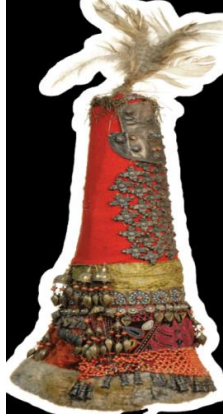
Resim 16. Saukele ön görünüm

Giysinin bulunduğu yer : 3327 numaralı, Kazakistan Cumhuriyeti Merkez Devlet Müzesine ait giysi.