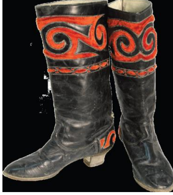
Resim 20. Motifli çizmenin ön görünüm

Giysinin bulunduğu yer : 21081 numaralı, Kazakistan Cumhuriyeti Merkez Devlet Müzesine ait giysi.