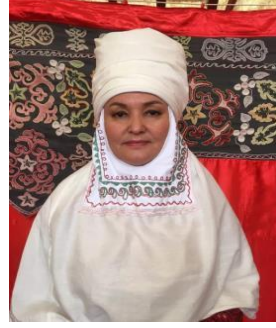
Resim 17-19. Kiymeşek ön görünüm

Giysinin bulunduğu yer : 21369 numaralı, Kazakistan Cumhuriyeti Merkez Devlet Müzesine ait giysi.