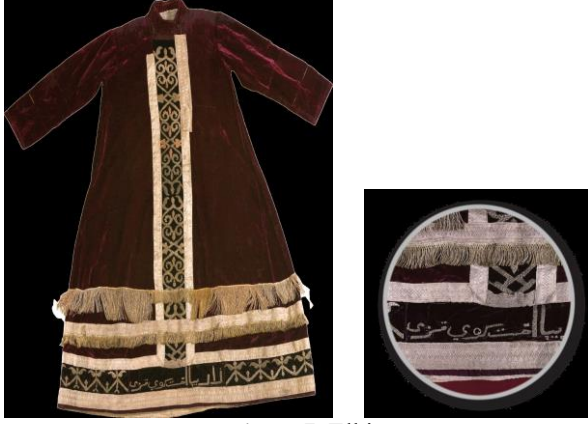
Resim 6-7. Elbise ön görünüm

Giysinin bulunduğu yer : 3388 numaralı, Kazakistan Cumhuriyeti Merkez Devlet Müzesine ait giysi.