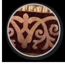
Resim 3-5. Elbise ön görünüm

Giysinin bulunduğu yer : 3696 numaralı, Kazakistan Cumhuriyeti Merkez Devlet Müzesine ait giysi.