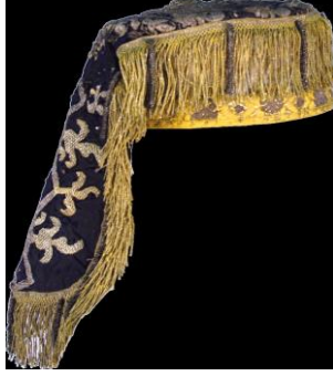
Resim 15. Kasaba ön görünüm

Giysinin bulunduğu yer : 3427 numaralı, Kazakistan Cumhuriyeti Merkez Devlet Müzesine ait giysi.