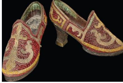
Resim 22. Süslü topluk ön görünüm

Giysinin bulunduğu yer :3871 numaralı, Kazakistan Cumhuriyeti Merkez Devlet Müzesine ait giysi.