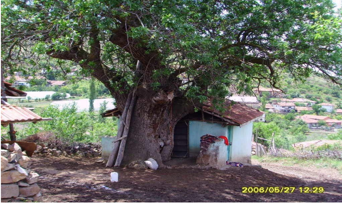
Ek 5: Öksüzler Köyü İsmail Ağa Dede Türbesi 32