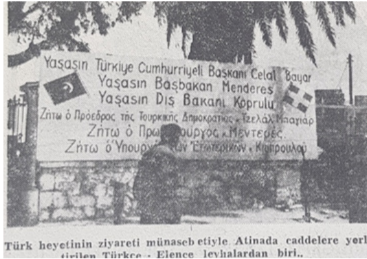
Şekil 5. Vatan 27 Nisan 1952

1952 yılının üst düzey ikinci ziyareti 22 yıl sonra Türkiye Başbakanının Yunanistan'a gidışıyle gerçekleşmiştir. 26 Nisan 1952'de Adnan Menderes ve Dışişleri Bakanı Fuat Köprülü, Atina'dan başlayarak Selanik'i de kapsayan 7 günlük bir ziyarette bulunmuşlardır. Atina'da büyük bir törenle karşılanan Menderes, Atina radyosundan Yunan halkına seslenmiştir. 111