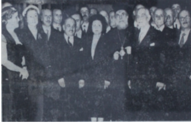
Şekil 4. Atina'da Türk-Yunan Birliği lokalinde Türk heyeti için düzenlenen kabul resmi. (Akşam, 31 Mart 1952)

Atina'daki Türk-Yunan Birliği, bu seyahatin başından sonuna dek Türk heyetinin yanında yer almıştır. Heyetin Atina'ya ulaştığı ilk gün yapılan kabul töreni Atina'daki Türk-Yunan Birliği lokalinde gerçekleştirilmiş ve Dışişleri Bakanı Venizelos, İçişleri Bakanı Konstantinos Rendis, eski Başbakanlardan Stilianos Gonatas ve tanınmış siyasi isimler de lokalde bulunmuşlardır. 110 Türk heyeti 5 Nisan'da dönene değin Yunanistan'daki birlik tarafından çeşitli toplantılar düzenlenmiş ve Türk heyetinin yanında olunmuştur.