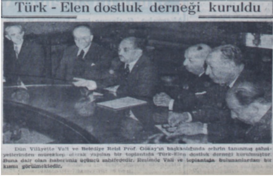
Şekil 2. Akşam , 1 Şubat 1952.

Kısa ömürlü dernekten geriye kalan tek derli toplu kaynak derneğin ana tüzüğüdür. Tüzükte derneğin amaçları, üyeleri ve birtakım kararlarla ilgili maddeler yer almıştır. Derneğin geçici merkezinin İstanbul Dördüncü Vakıf Hanın üçüncü katı (İstanbul Ticaret Odasında) olduğu belirtilmiştir. 19 Ancak 18 Haziran 1952 tarihinde Bakanlar Kurulu, hazineye intikal eden Şişli Halkevi binasının zemin katında bulunan bir odanın derneğe tahsis edilmesi kararını almıştır. 20 Tüzüğe göre derneğin amacı Türk ve Yunan vatandaşları arasında dostluk ve yakınlaşmayı geliştirmektir. Bunun için: