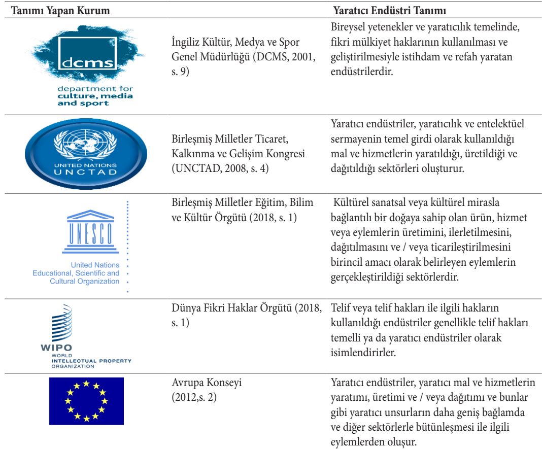
Tablo 1: Egemen Siyasa İçerisinde Yaratıcı Endüstri Tanımları

metalaşma örüntüsünün kurulması için “cezbedici” bir nitelik arz ettiği bu doğrultuda öne sürülebilir. Ancak henüz yaratıcı endüstrilerin, yükseköğretim bileşenleri içerisinde nasıl yer bulabildiğine dair kapsamlı bir tartışmanın öncesinde, ekosistemin egemen siyasa içerisindeki “topografyasının” görünür kılınması gerekir. 1990’lı yılların sonundan itibaren öncelikle Avustralya, “ Creative Nation ”, ardından İngiltere’de, “ Creative Task Force ” projesi üzerinden, yeni bir siyasa ve uygulama alanı olarak gelişen yaratıcı endüstrilerin; henüz tanımlanma ve sınırlarının belirlenmesi aşamasından itibaren bilgi toplumu dönüşüm sürecinin yol açtığı özel bir uğrak olarak değerlendirildiği söylenebilir 1 . Tablo 1 içerisinde birbirinden farklı konumları temsil etmelerine ve değişen perspektiflerine rağmen yaratıcı endüstriler ekosistemi söz konusu olduğunda egemen siyasanın tıpkı farklı “çalgalara” sahip olmakla birlikte uyum içerisindeki bir orkestranın ezgisini oluşturduğu görülmektedir. Gerçekten de birbirinden farklı siyasal “duruşa” sahip olsalar da yaratıcı endüstriler söz konusu olduğunda ortak kavramların refah ve istihdam olanaklarını vurguladığı görülmektedir.