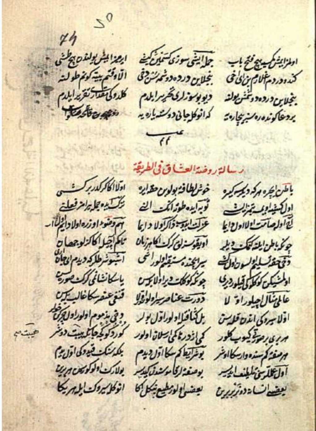
Resim 4: 74a