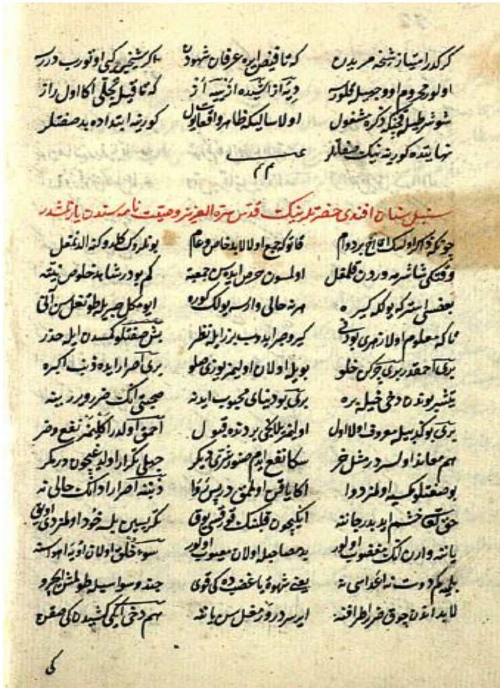
Resim 1: 72b