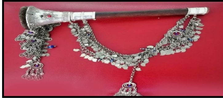
Fotoğraf 10: Telkâri işlemeli zurna (31.12.2020)