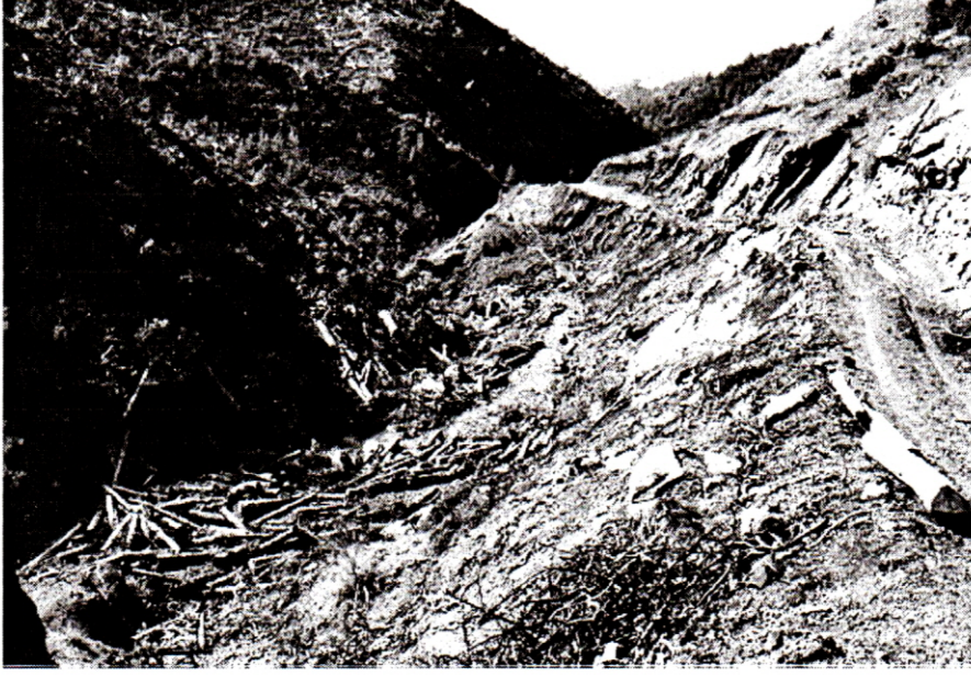
Şekil 3 : Doğal bitki örtüsü ile beraber iki yanı tamamen tıraşlanmış, içine tomruklar dolmuş bir akarsu (K.Maraş)

Orman yolları, su kaynakları ve çevresinde aşırı zararlara yol açabilmektedir. Bu nedenle akarsu ile orman yolu arasında doğal yapısı bozulmamış bir tampon bölgenin bırakılması önerilmektedir (WIEST 1998). Bu tampon bölgenin genişliği arazinin eğimine göre değişmektedir (Tablo 5).