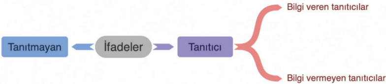
Şekil 2: Swinburne’e göre ifadeler (word) ikiye ayrılır.

O halde, bedenimdeki ve ben ile işaret ettiğimdeki “ben” kimdir? Descartes’a itiraz edenler, Descartes’ın ve kendilerinin “ben” ile ne kastettiklerini bilmediklerini söylemektedir. Swinburne bu itirazı değerli bulur; bu, kendisine de yöneltilebilecek bir itirazdır. Devamında gelen bölüm olan We Know Who We Are bu itiraza ayrılmıştır. O, “Ben”in bilgisinin bizde mevcut olduğunu iddia eder. Bize, bilmenin doğasına dair kavramsal bir şema sunar: