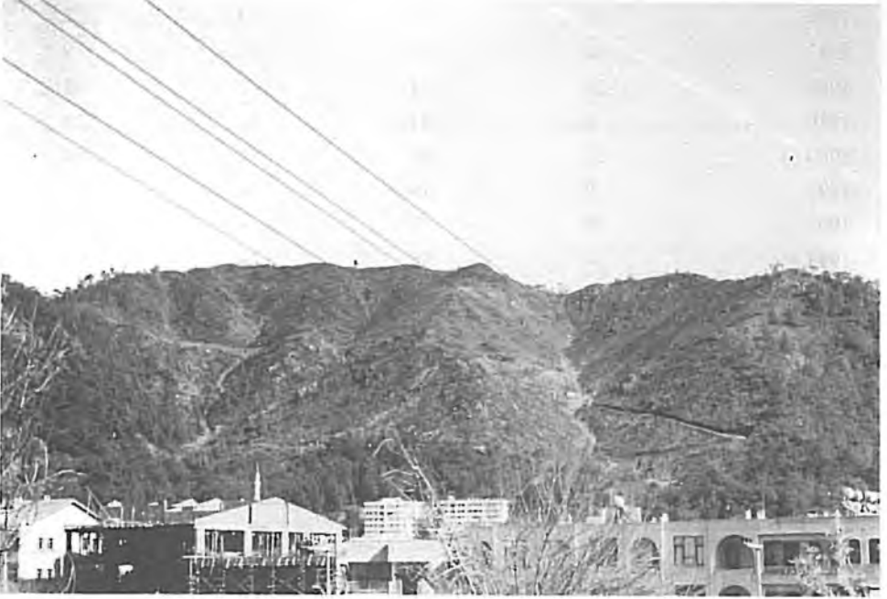
Resim 1 : Marmaris Kentinin Hemen Yanında Yanan Orman alanı

- Daha önce belirtilen orman içi dinlenme yerlerindeki aşırı yararlanmalar, bu alanların orman toprağına, bitki örtüsüne ve faunasına zarar vermektedir. Bu orman içi dinlenme yerlerinin bi-tişğine kurulacak tesislerin seçiminde gereken özen gösterilmemektedir.