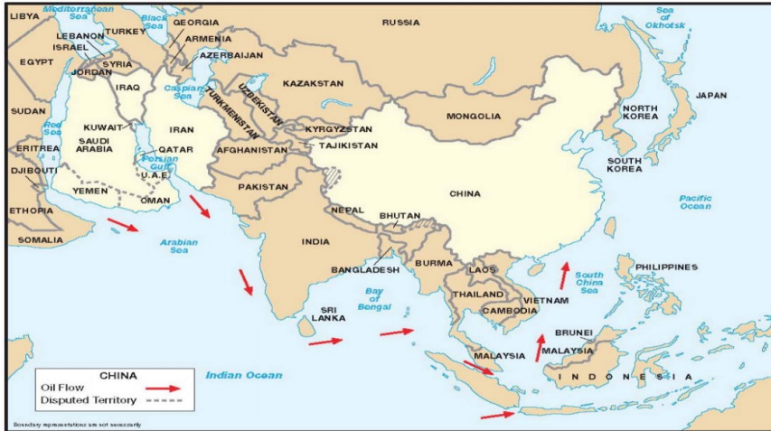
Figure 1. China's Critical Sea Lanes. China is heavily dependent upon critical sea lanes for its energy imports. Some 80% of China's crude oil imports transit the Straits of Malacca.