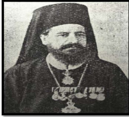
Fotoğraf 2 Üsküp Rum Metropoliti Fermiliyan Efendi

basınında da bu tayinin yapılması ile Patrikhanenin boyunduruğu altına girildiği gerekçesiyle bazı tepkiler oldu 37 .