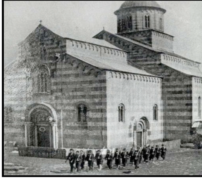
Fotoğraf 3 St. Sava Manastırı'nı Koruyan Osmanlı Zaptiyeleri