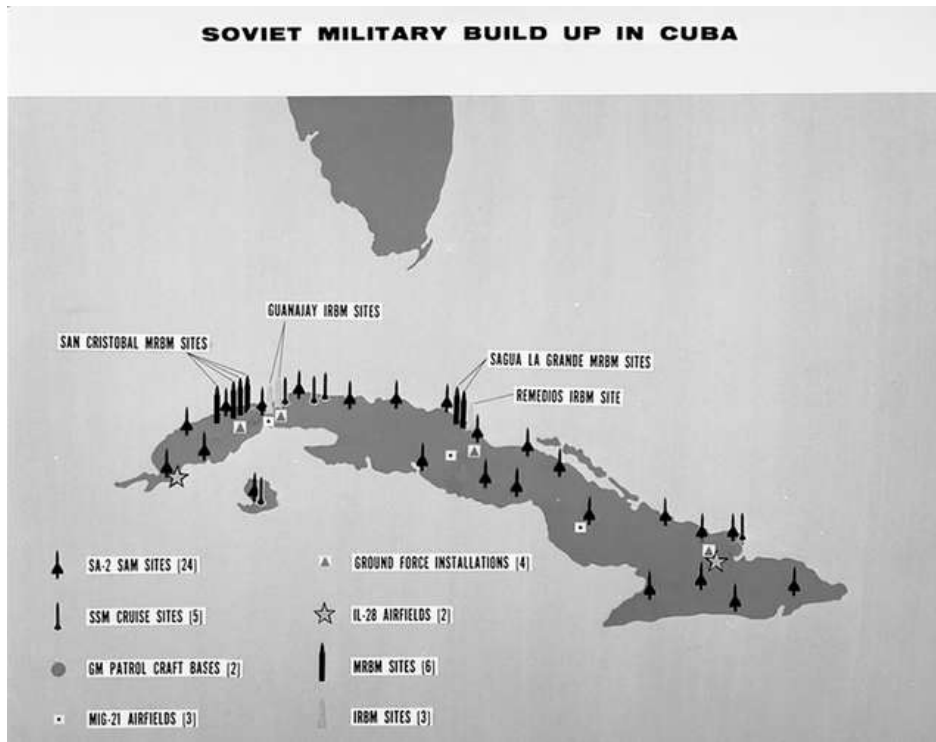
Harita-1 Küba'daki Sovyet Askeri Varlığı- Ekim 1962 ("Cuban missile crisis-[britannica]", 2020)

Krize yol açan füzeler ise Temmuz ayı sonlarında gemilere yüklenmiştir. 1 Eylül tarihinde karadan havaya füzeler, Sopka kıyı savunma füzeleri, gemi savunma füzeleri ile donatılmış devriye botları ve 5000'den fazla Sovyet teknisyeni ve askerinden oluşan Sovyet askeri varlığı Küba'ya ulaşmıştır. İlk Sovyet füzesi 8 Eylül'de Küba'ya ulaşmış, Orta Menzilli Balistik Füzeler (MRBM), buna ait füze römorkları, yakıt kam-