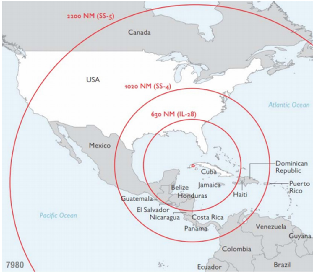
Harita-2 Füzelere kapsama alanı (“Cold War and The Cuban Missile Crisis, 1962”, 2017)

Küba Füze Krizi'nin kronolojik sıralaması şu şekildedir: