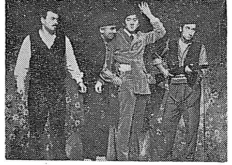
Türk Tiyatro San'atına büyük darbe vuran «KELEPÇE» adlı oyunun bir sahnesinde his istismarcılarını ifadelendirenler toplu halde....!

GERÇEKTEN HİKÂYE : Bir ekim günü, yağmur ve soğuğa rağmen, Özel Fatih Tiyatrosu'nun salonu sıcaktı... Ve boştu. Gişe açıktı ve gişenin camında aylık biletlerin satışa çıkarıldıkları yazılıydı.