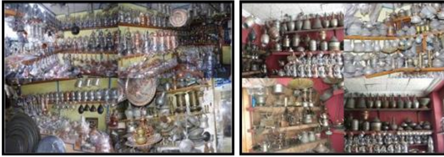
Fotoğraf 2-3. Gerede’de Bulunan Bakırcı Dükkanlarından Görüntüler

Geredeli bakırcı ustalarının aktardığı üzere, bakırcı ustaları babadan oğula ya da usta çırak ilişkisi şeklinde yetişmişlerdir. Gerede’de geçmişte bakırcılıkla evini geçindiren insanların sayısı oldukça fazla iken günümüzde bu el sanatı ile uğraşan çok az kişi kalmıştır. Bunun sebebi piyasada daha ucuz diğer metallerden üretilen eşyaların çoğalması ve mesleğin yeterince para kazandırmamasıdır.