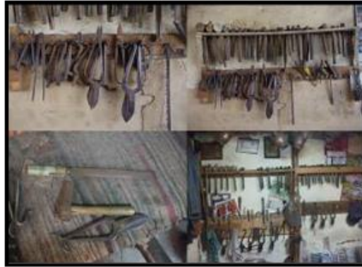
Fotoğraf 11. Çeşitli Şekil ve Boyutlarda Çekiçler, Tokmak, Maşa (Kısac), Pergel, Ege ve Çeşitli Zımbalar

İbriğin parçaları, aşağıdan yukarıya doğru, dip, ayak, gövde, boğaz, emzik, sap (kulp), kapak olarak adlandırılmıştır.