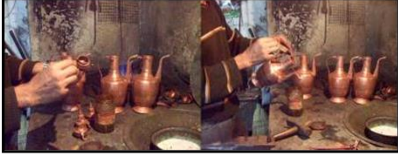
Fotoğraf 20. İbriğin (Upruğun) Kapak, Kulp, Emzik ve Dip Kısımının Lehimlenerek Takılması