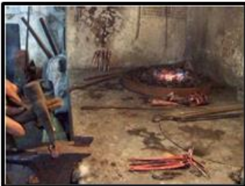
Fotoğraf 16-17-18. İbriğin (Upruğun) Sap (Kulp) Kısımının Yapılışı

Sap (Kulp): İbrikte yerleştirileceği yerin büyüklüğüne göre kulplar ocakta tavına getirilerek ve dövülerek oluşturulmaktadır (Fot. 16-17-18).