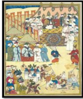
(Atıl, 1999, s. 154).