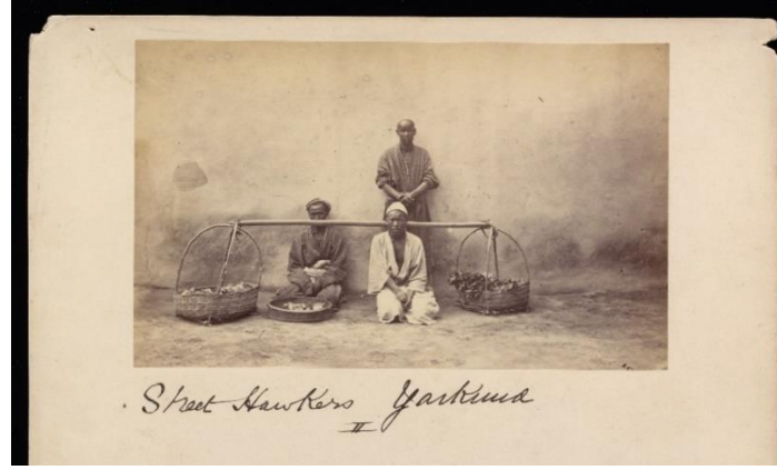
Street Hawkers Yarkund