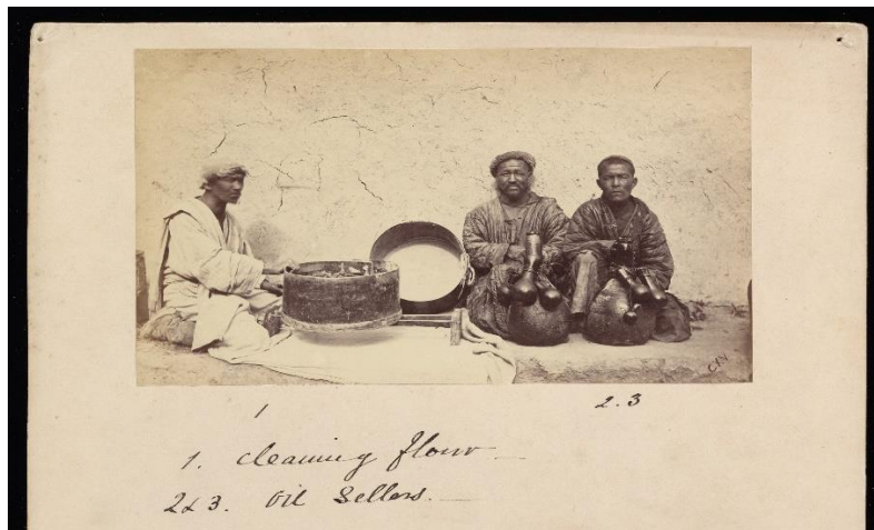
Ek 3 Yağ ve un satıcıları.