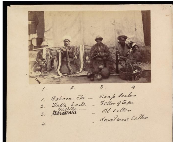
1. Sabon-çi - Soap dealer 2. Laha-baid. - Seller of tape 3. Yag-çi - Oil seller 4. Sarmal-meat Seller