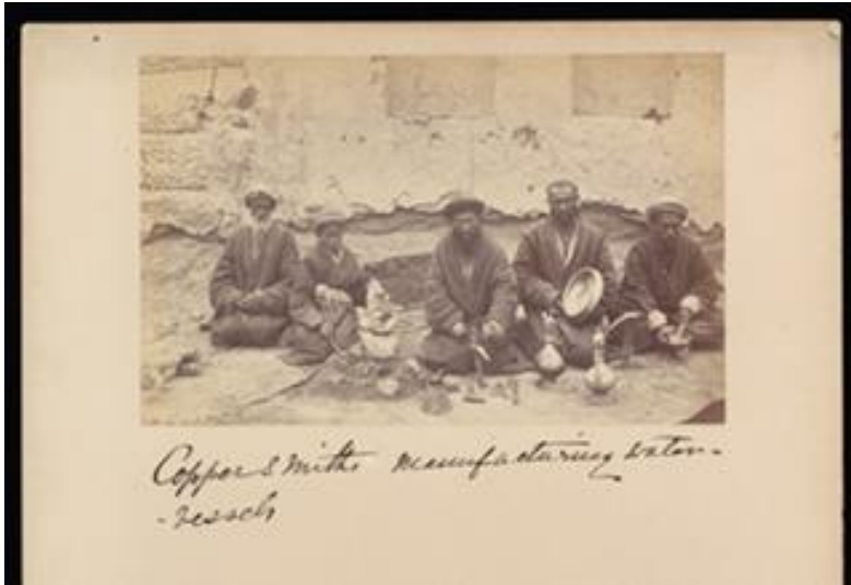
Ek 2 Kalaycılar Hoten.