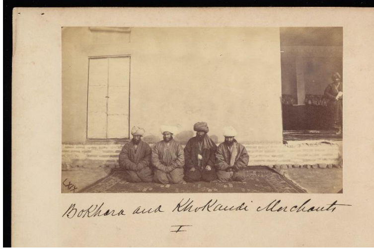
Ek 1 Buhara ve Hokandlı Tüccarlar.