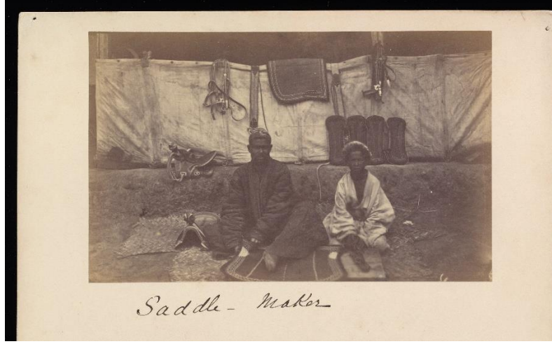
Ek 4 eyer ustaları.