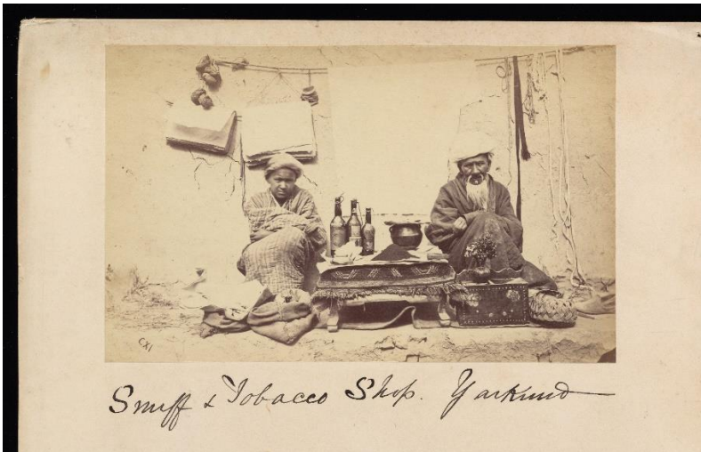
Ek 6 Yarkent pazarında enfiye ve tütün satanlar.