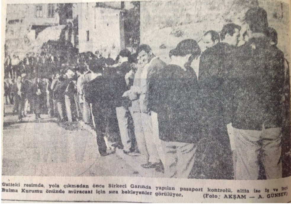
Üstteki resimde, yola çıkmadan önce Sirkeci Garında yapılan pasaport kontrolü, alfta ise iş ve işçi Bulma Kurumu önünde müracaat için sıra bekleyenler görülüyor.