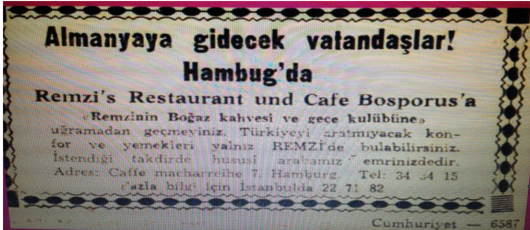
Fotoğraf-12. Almanya'daki Türk girişimcilerinin müessese reklamları

Gazetede yine Türk girişimciler tarafından Hamburg'ta hayata geçirilen bir lokantanın Türk müşterileri çekmek adına verdikleri reklam dikkati çekmektedir. Bu da Almanya'daki Türklerin iş hayatının hemen hemen her alanında varlık göstermeye başladıklarının ilk belirtilerinden biri olarak değerlendirilebilir.