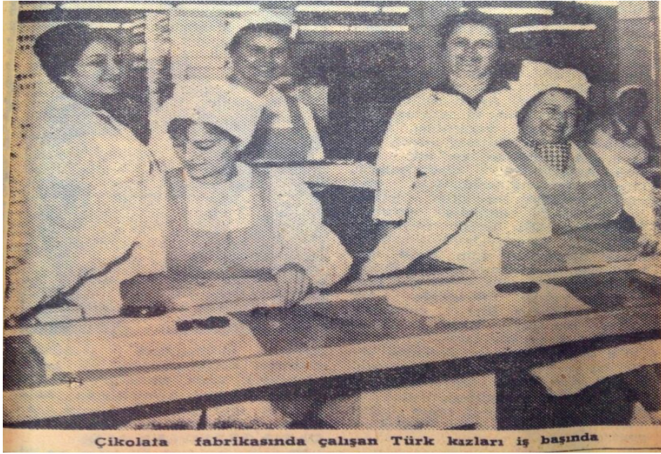
Fotoğraf-5. Çikolata fabrikasında çalışan Türk kızları (Akşam, 30. 08. 1963)