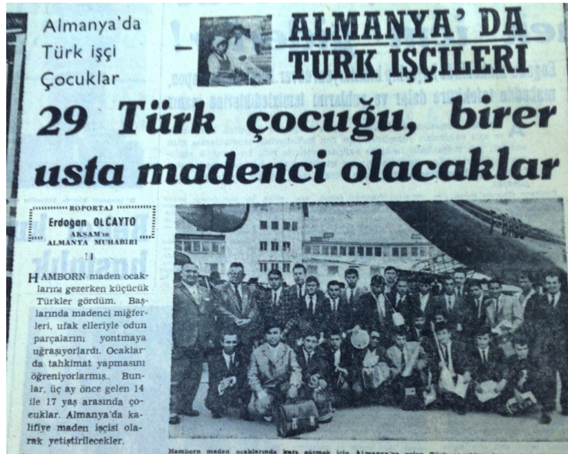
Fotoğraf-2. Almanya maden ocaklarında çalışmak üzere Almanya'ya giden çocuk işçiler

Almanya, savaş sonrası atılımlarla ekonomisini güçlendirirken, artan oranda da kalifiye işçiye ihtiyaç hissetmiştir. Bu nedenle işçi açığının büyük bir kısmını Türkiye'den karşılamak isteyen Almanya, otomotivden, hayvancılığa, madencilikten, sağlık ve tarıma kadar her alanda çalışmak üzere Türkiye'den işçi talep etmiştir. Bu konuya dair gazetede 8 adet haberin yer aldığı ve ilgili haberlerde Almanya'nın istediği işçilerinin niteliklerinin değişkenlik gösterdiği görülmektedir. Bu bağlamda, Almanya'nın o dönemde her sektörden işçilere ihtiyaç hissettiği bir realitedir. Fakat en çok da maden sektöründe çalıştırmak üzere Türkiye'den işçi talep etmişlerdir. Almanya tarafından maden ocaklarında çalıştırılmak üzere istenen işçiler arasında maalesef çocukların da yer aldığını görmekteyiz. Buradan hareketle, Türkiye'de 2014'de meydana gelen Soma maden faciasında kayıpların çok olması özellikle Batılı ülkeler tarafından çokça eleştiri konusu yapılmış ve bu ülkelerin başında da Almanya yer almıştır. Fakat çok uzak bir tarih olmamasına rağmen Almanya'nın sırf kalkınma adına Türkiye'den özellikle çocuk işçileri de istemesi ve bunları madenlerde çalıştırmayı düşünmesi bir çelişki olarak karşımıza çıkmaktadır. Bahsi geçen bu durum gazetenin, " Almanya'ya 40 işçi çocuk gönderilecek " (15.11.1963, S:1) başlıklı haberinde, Almanya'daki maden ocaklarında yetiştirilmek üzere, ilk defa Türkiye'den 14-16 yaşlarında 40 kadar çocuğun Essen şehrine gönderileceği şeklinde yer almıştır.