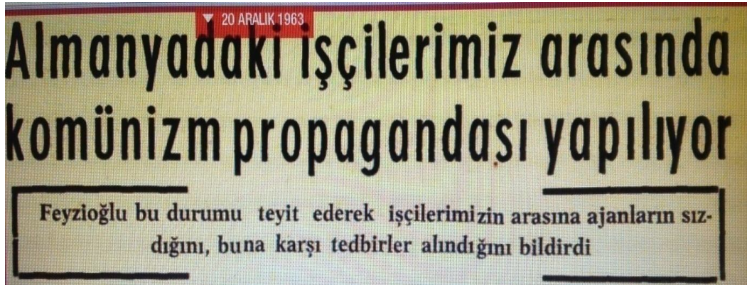
Fotoğraf-10. Almanya'daki Türk işçileri arasında Komünizm propagandası

Gazetede Türk işçilerinin Almanya'daki sosyal ve ekonomik alandaki faaliyet ve girişimciliklerine dair bir adet habere yer verildiğini görmekteyiz. " Almanya Türk öğrencileri birliği derneği kuruldu " (30.05.1961: S.1) başlıklı haberde, Almanya'nın muhtelif şehirlerinde bulunan yaklaşık 2.000 Türk öğrencinin oluşturduğu 16 Türk öğrenci derneğinin, Türk öğrencilerini temsil etmek ve menfaatlerini korumak amacıyla "Almanya Türk Öğrencileri Dernekleri Birliği" adı altında birleştikleri duyurulmaktadır.