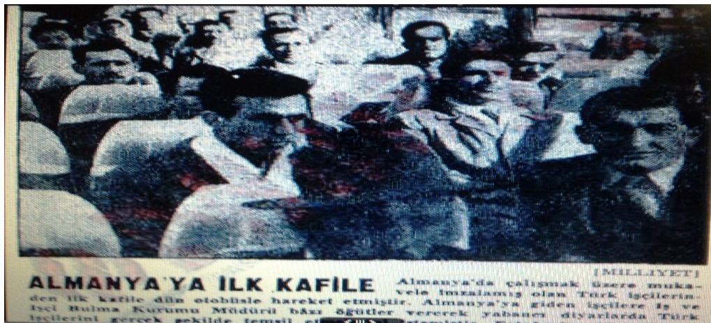
Fotoğraf-8. Almanya'ya Otobüsle çıkan İlk Türk Kafilesi (Milliyet, 26.02.1961: S.1)