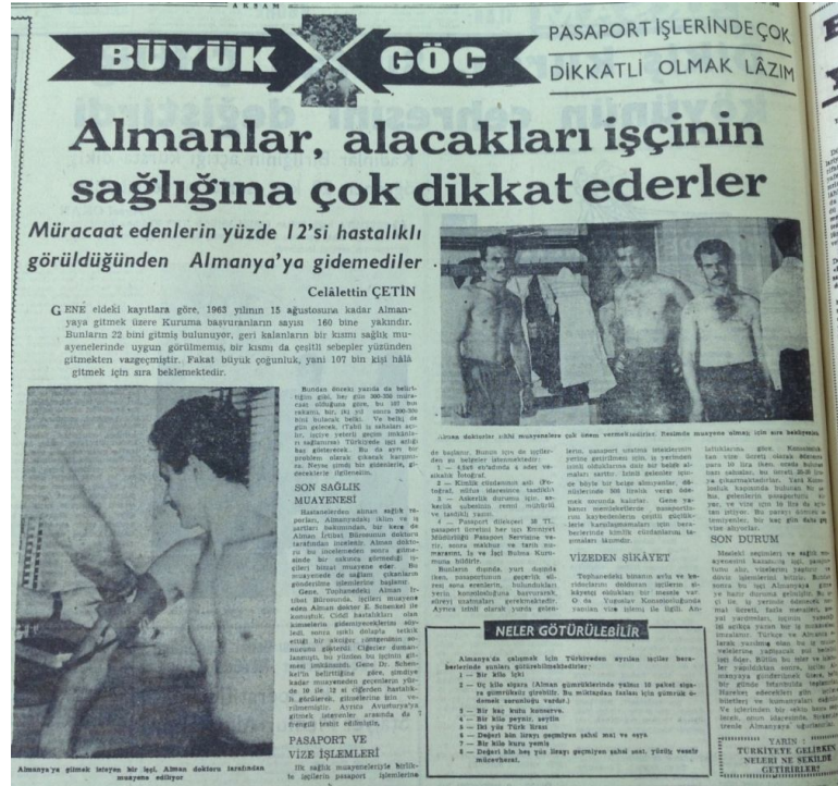
Fotoğraf-3. İstanbul Tophane'deki Alman irtibat bürosunda Türk işçilerinin sağlık taraması (Akşam,26.09.1963)