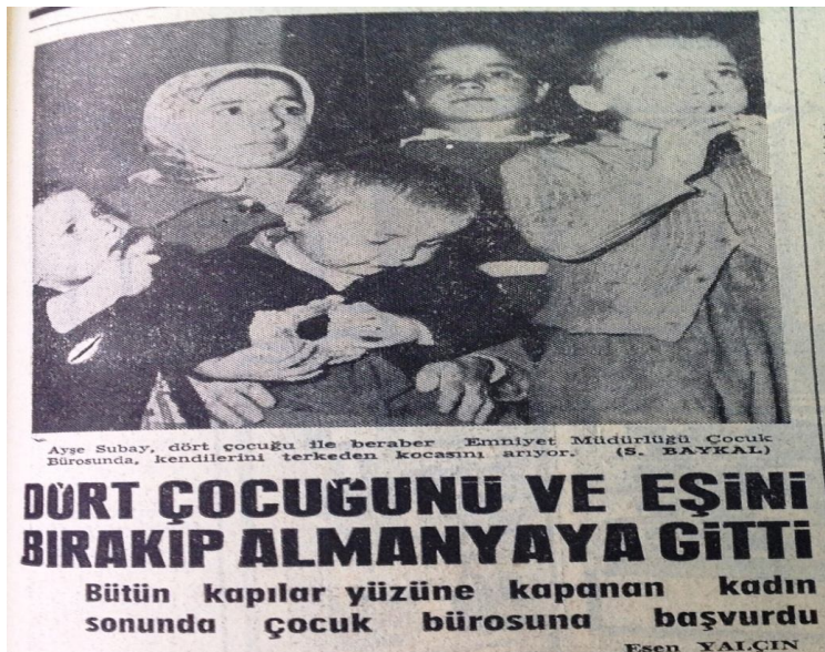
Fotoğraf-7. Eşi tarafından 4 çocuğuyla terk edilen kadının dramı (Akşam, 03.10. 1963, S:1)

Siladan, vatandan uzak kalmak demek, yardan, anadan, babadan, çoluk çocuktan, arkadaştan ve doğup büyüdüğü yerlerden uzak kalmak anlamına gelmektedir. İstisnasız her gurbetçinin arkada bıraktığı bu tarz hikâyeleri, yaşanmışlıkları mevcuttur. İlk etapta kısa sürede dönülecek umuduyla fazla tesir etmeyen bu hasret ve ayrılık, işin kalıcılığa dönüşmesiyle birlikte dramatik bir boyut kazanmaya başlamıştır. Akşam gazetesinde de bu tarz haberleri görebilmek mümkündür. Bunlardan belki de en çarpıcı olanı "Dört çocuğunu ve eşini bırakıp Almanya'ya gitti" (03.10.1963, S:1) haberidir. Haberde 28 yaşındaki bir annenin 4 küçük çocuğuyla birlikte Emniyet Müdürlüğü'ne gelerek kendilerini 6 ay önce terk eden kocasını gözyaşları içerisinde aradığı belirtilmektedir (fotoğraf-5). İlerleyen yıllarda bu tarz haberlerin sıkça duyulan konular arasında yer aldığını ve bu görüntülerin parçalanmış aileler için dramatik bir durum teşkil ettiğini söyleyebiliriz. Almanya'da kalıcılıkla paralel olarak özellikle erkeklerin yabancı kadınlarla evlenmesi sonucu aile parçalanmalarının ve bu yakıcı durumun daha belirgin hale geldiğine şahit olmaktadır.