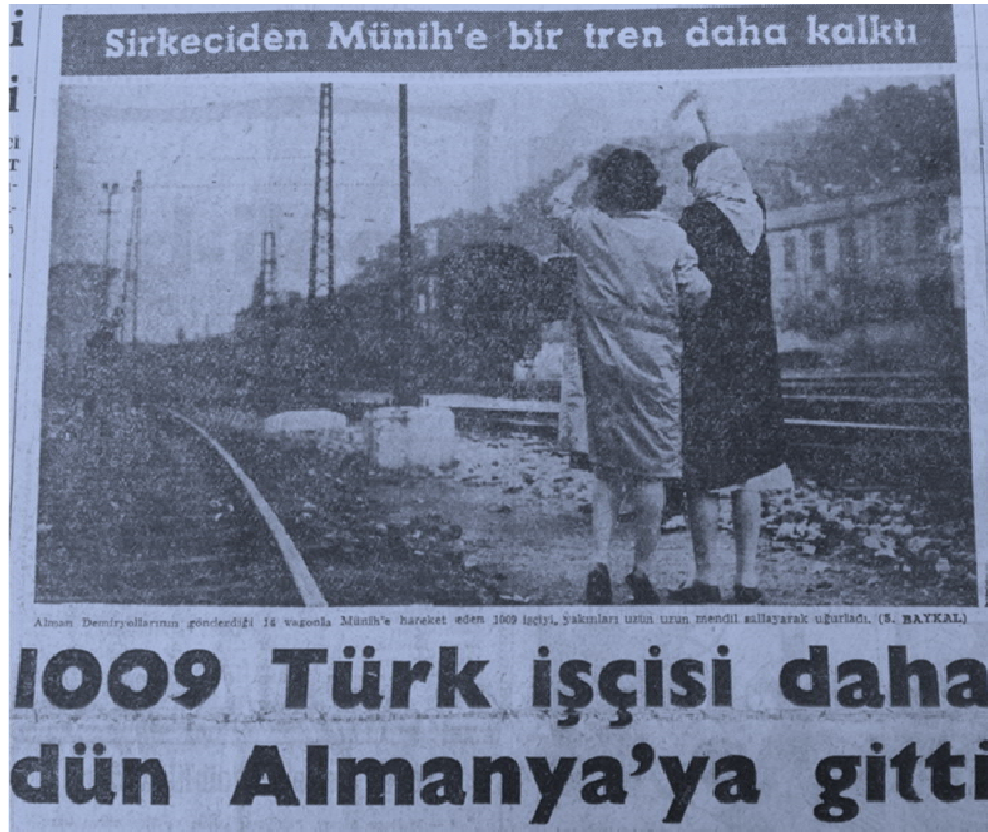
Fotoğraf -1. Sirkeci garından Almanya'ya hareket eden tren ve onları uğurlayan yakınları.

Türk rock müziğinin önemli isimlerinden ve siyasi sebeplerden ötürü Almanya'da uzun yıllar yaşamış olan Cem Karaca, Türklere karşı değişen Alman bakış açısını protest tarzda şu şekilde ifade etmiştir: