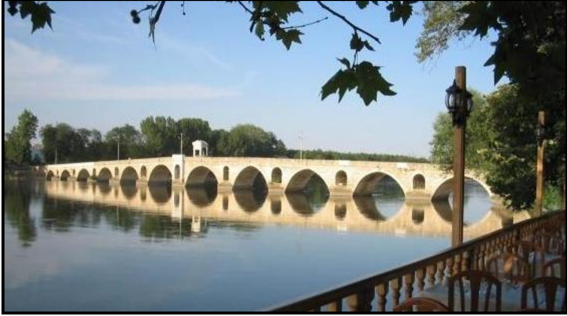
Şekil 2. Tunca Köprüsü (Anonim, 2010b) Figure 2. Tunca Bridge (Anonymus, 2010b)

içinde; Maarif Caddesi'nde yer almaktadır. Restorasyon projeleri hazırlanan ve bir bölümü restore edilen konutların restorasyon ve rehabilitasyon çalışmaları devam etmektedir.