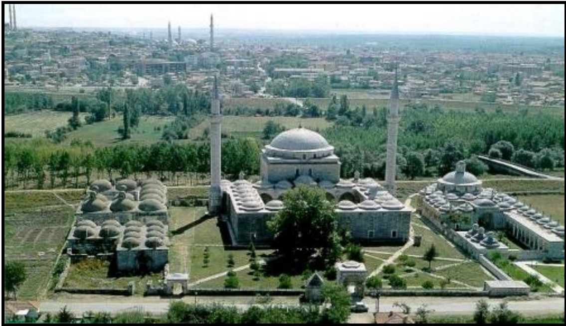
Şekil 3. II. Beyazıt Külliyesi (Anonim, 2010c) Figure 3. II. Beyazıt Complex (Anonymus, 2010c)

Kaleiçi , bugüne duvar kalıntıları ve bir kulesi ile ulaşan Roma Kalesi'nin kurulduğu alanda yer alan semttir. Kale Bizans ve Osmanlı dönemlerinde çeşitli onarım ve eklerle 19.