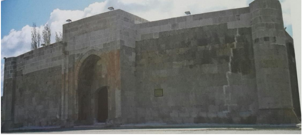
Resim 4- Mahperi Hatun Kervansarayı, Tokat İli Pazar İlçesi (Sunay 2007: 255)