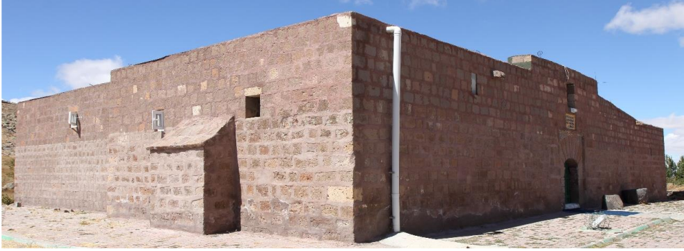
Resim 3- Şeyh Turasan Zaviyesi Dođu-Güney Cephe Görünümleri (Turgut 2015: 182)

Yalman (2017: 242-244); Mahperi Huand Hatun'un banilik yaptıđı mimari sınıflama üzerinden bir soru sorar ve neden Şeyh Turasan Zaviyesi gibi bir yapının baniliđini üstlenmiş olabileceđi sorusuna cevap bulmaya çalışır. Osman Turan 18 ve Danişmend Gazi destanına atıflar vererek tartışmasını başlatır. Turasan'da geçen Hasan'ın Danişmend Gazi'ye, Türk seferleri esnasında eşlik eden bir kişiye ait olma ihtimalinden bahseder. Bölgenin hac ve ziyaret bölgesi olmasına değinir. Bu bölgenin ve Şeyh Turasan'ın ziyaret bölgesi olmasının Huand Hatun için önemli olabileceđi noktasında görüş bildirir ve Tur Hasan'ın daha çok tarihî kimliđi üzerinden yola çıkarak, kendisinin (Mahperi Huand Hatun) de bu şekilde anılmak isteme arzusu içerisinde olabileceđi üzerinde durur.