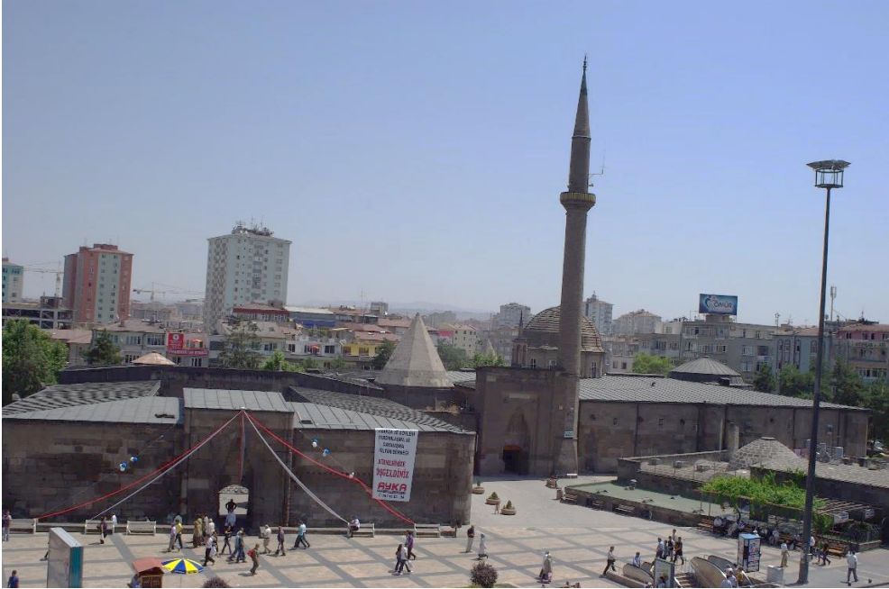
Resim 2- Kayseri Mahperi Huand Hatun Külliyesi