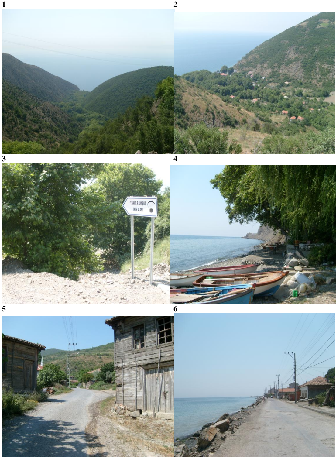
Şekil 2. Şarköy kıyı yerleşimlerine ilişkin fotoğraflar (1-5 Uçmaktdere, 6 Gaziköy) Figure 2. Şarköy coastal land use (1-5 Uçmaktdere, 6 Gaziköy)