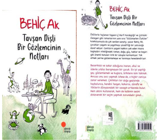
Görsel 1: Dış Kapaklar (Ön ve Arka)

Kitap ebadı 12x18'dir. Dış kapağı ince kartondan oluşan eser 2. hamur kâğıda basılmıştır. Eserin dış kapakları estetik bir çizgiye sahip olmakla birlikte yeşil ve beyaz tonlar ağırlıktadır. Kitap hacim olarak taşınabilir, kitaplık düzenlemesine elverişlidir. Sayfaların kenar boşlukları ve cümlelerin satır aralıkları uygundur.