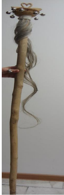
Şekil 8. Kuğu baston