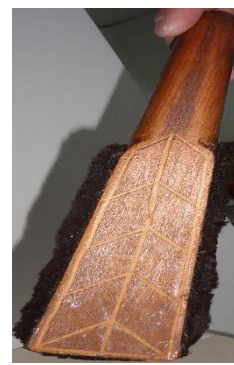
Şekil 6. Tokmak