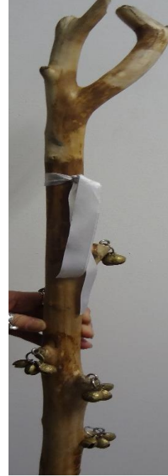
Şekil 9. At başlı baston