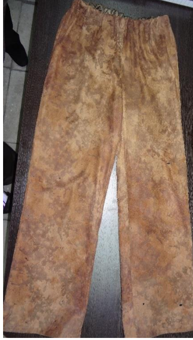
Şekil 2. Pantolon