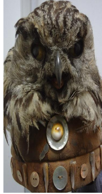
Şekil 3. Şapka