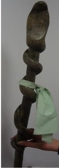
Şekil 7. Yılan baston

Diğer “baston” yılan figürlüdür. Eski zamanlardan beri yılanın, eczacılığın ve şifanın kaynağı olarak düşünüldüğü bilinmektedir. Kamın bu yüzden yılan figürlü baston temin ettiği tahmin edilebilir. Bu “baston”a ise beyaz ve yeşil olmak üzere iki kısa “şerit” bağlanmıştır. Sonuncu “baston”a ise kır at “kuyruk”u, ak bir “şerit” ve ayrıca küçük “zil”ler asılmıştır. Bu bastonun çanak şeklindeki tepesinde ise aşkın sembolü olan ve birbirine sarılmış olan iki “kuğu” bulunmaktadır. L. V. Kobecikova, önceki yaşamında 13 kuğu olduğunu söylediği için bir arkadaşı bu kuğuları hazırlamış ve sopaya sabitlemiştir.