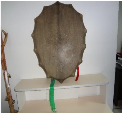
Şekil 4. Davulun ön yüzü

Çubuğa kırmızı, yeşil, beyaz, mavi, gri gibi farklı renklerde “kurdele”ler, aynı zamanda değişik boyut ve şekillerde “çingirak”lar bağlanmıştır. “Davul”un iç kısmından bir ip geçirilmiş olup, bu ipe yine iri bir “tilki kuyruk”u asılmıştır. Başka şamanlara ait “davul”larda değişik resimler olduğu hâlde L. V. Kobecikova’nın “davul”unda çizilmiş herhangi bir resim bulunmamaktadır. “Tokmak” ise sırt kısmında sağlı sollu çizgiler taşımaktadır. “Tokmak”ın ön yüzü, koyun derisinden olup yünleri kırılmamıştır. “Tokmak”ın çok fazla kullanıldığı yünlerin aşınmasından anlaşılmaktadır.