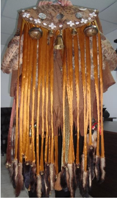
Şekil 1. Kaftan