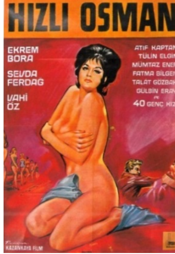
Resim 3 (Hızlı Osman Film Afişi)

60'lı ve 70'li yıllarda özellikle sinemada görülen erotik ve cesur kadın imajına basın ilanlarında da rastlanmaktadır. 1964 yılında Hasan Kazankaya tarafından yönetilen ve güzellik yarışmasına katılan genç bir kızın maceralarının anlatıldığı Hızlı Osman filmi, dönemin içeriğini yansıtmaktadır. 60'lardan sonra fotoğrafların daha ağırlıklı kullanıldığı sinema afişlerinde illüstrasyon örneklerine de rastlamak mümkündür. Bu afişte yer alan çıplak kadın illüstrasyonu, sarı-kırmızı tonlarında kullanılan sıcak tonlar dönemin akımı olan erotik etkiyi yansıtmış, kadın burada da güzelliği ve vücudu ile ön planda tutulmuştur. Basın ilanları, afişlerde kullanılan illüstrasyonlar dergi ve gazetelerde de kullanıldığı için yukarıdaki örnekler çalışmaya eklenmiştir.