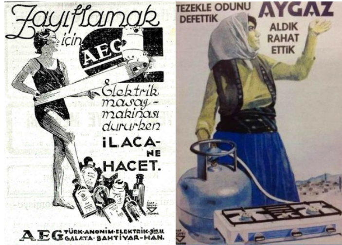
Resim 1 (AEG Basın İlanı) Resim 2 (Aygaz Basın İlanı)

Basın ilanları Türk grafik tasarım tarihinde de sıkça görülür. Dijital ekranların çoğalmasından dolayı yayıncılığın azalmasıyla sayıları düşse de hala kullanılan bir grafik tasarım ürünüdür. Geçmişten bugüne bakıldığında kadın figürünün basın ilanlarında da aktif bir rol aldığını söylemek mümkündür. Özellikle Cumhuriyet sonrası gazete ve dergiciliğin arttığı, teknolojik anlamda fotoğrafın daha az kullanıldığı yıllarda basın ilanları ve ilanlarda yer alan illüstrasyonlarda çok çeşitli kadın figürlerine rastlanmaktadır.