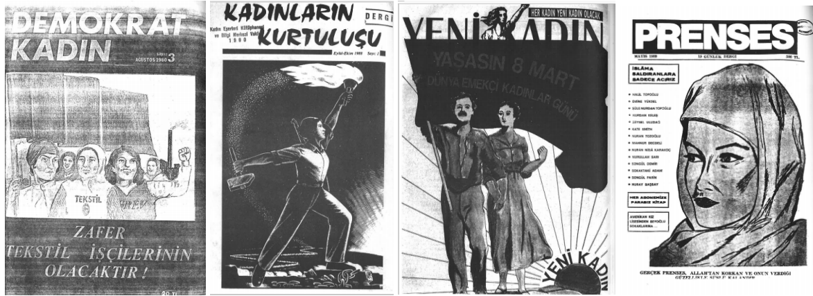
Resim 10 (1980-2000 Tarihleri Arasında Yayımlanan Süreli Yayın Örnekleri)

dergilerdir. Bu fotoromanlar çoğunlukla birbirlerine aşık bir kadın ve erkeğin hikayesi üzerine kuruludur. Her iki kapak örneğinde de güzel ve yakışıklı karakter çizimleri yapılmıştır. İkimiz Dergisi örneğindeki erkeğin bakışı kadının erkeğe düşkün hali ve erkeğin omzundaki yabancı kadın eli karmaşık ve bir yandan da muzur bir ilişkiyi vurgularken, Samanyolu Dergisi örneğindeki karakterlerin masum duruşu Türk filmlerine konu olacak masum bir aşkı anlatır niteliktedir. Fotoromanlar sinema izler gibi, okuyucunun kendisini hikâyeye kaptırmasını sağlamak durumundadır. Bu sebeple illüstrasyonlarda gerçekçilik ve mimikler çok önemlidir. Her iki örnekte de bu detaylara dikkat edildiği söylenebilir.