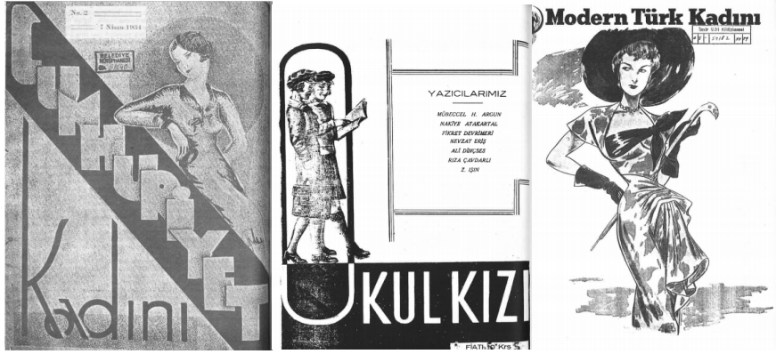
Resim 8 (1923-1950 Tarihleri Arasında Yayımlanan Çağdaş Kadın Konulu Süreli Yayın Örnekleri)

Cumhuriyet ve devamında 1934 yılında kadınlara verilen seçme ve seçilme hakkı ile kadının toplumdaki görünürlüğü daha artmıştır. Eğitimli, modern giyimli, çağdaş bir kadın imajı çizilmiştir. Görsel 8'de yer alan, ilk yayın tarihlerine göre Cumhuriyet Kadını (1934), Okul Kızı (1937) ve Modern Türk Kadını (1950) dergileri bu imajı destekleyen süreli yayınlardandır.