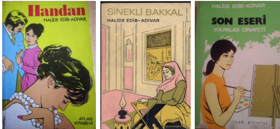
Resim 11 (Halide Edip Adıvar Kitaplarından Örnekler)

Sürelî yayınlarda olduğu gibi kadın konulu kitaplarda da sayısız yayınına rastlamak mümkündür. Özellikle Cumhuriyet ve yeni harflerin kabulü ile kitap sayıları artış göstermiştir. Kadın Eserleri Kütüphanesi ve Bilgi Merkezi Vakfı Yayınları tarafından 2006'da çıkarılan Kadın Konulu Kitaplar Bibliyografyası 1729-2002 arasındaki kitapları detaylı şekilde listelemiş iyi bir kaynaktır. "Tarihi belirlenemeyen kitaplar göz önüne alınmadığında; Osmanlı Türklerinin 1729-1923 yılları arasında 196 yılda kadın konulu yayımladıkları kitap sayısı 54 iken, Cumhuriyet döneminde 1925-1939 yılları arasında, başka bir söyleyişle 14 yılda yayımlanan kitap sayısı 54'tür. Örneğin yalnız 1937 yılında yayımlanan kitap sayısı 20'dir. Bu sayı 1966'da 36, 1968'de 40, 1973'te 56, 1977'de 73, 1986'da 84 iken 1992'de 98'e, 1996'da 139 sayısına ulaşır. Bu sayılarla Cumhuriyet döneminde kadın konusunun Osmanlı devletinden ayrılmı olarak ne denli ciddiye alınıp, önemsendiğini söyleyebiliriz" (Yalçın, 2006: 11).