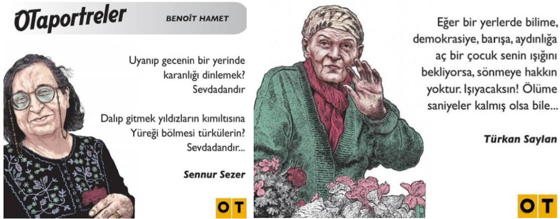
Resim 17 (Otaportreler Bölümünden Örnekler-2)

Yukarıdaki örneklerde; “Tiyatro varsa ben varım.” diyerek mesleğine duyduğu aşkı dile getiren, Türk tiyatrosunda sahneye çıkan ilk kadın oyuncu olan Afife Jale ve gerçek gücün kişinin kendisinde olduğunu vurgulayan motivasyon cümlesi ile senarist ve yazar Ayşe Şasa yer almaktadır.