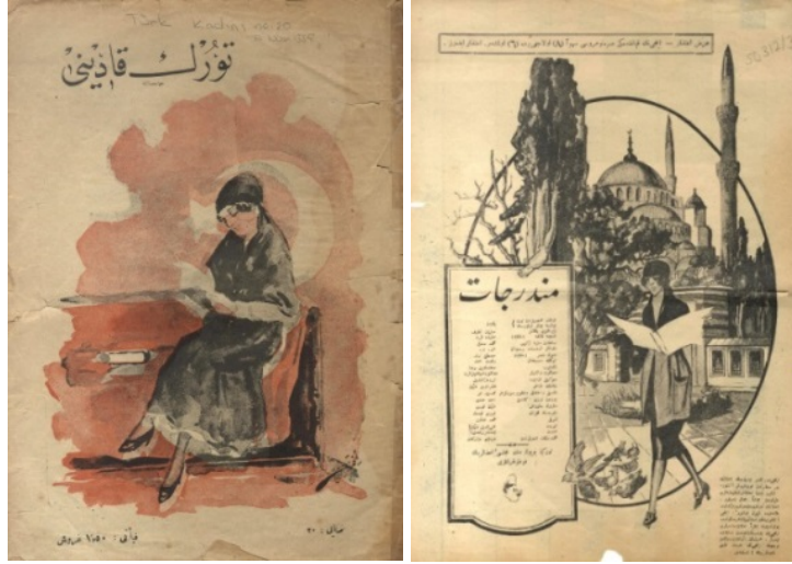
Resim 4 (Osmanlı Dönemi Kadın Dergileri Örnekleri)

Ancak kadın hareketlerinin ve feminist yaklaşımların dünyada çoğalması ve Osmanlı'nın son dönemlerinde bilinirliğinin artması ile kadın konusunun farkındalığı artmıştır. "Türk kadınının, ilk Türk kadın dergisi ile tanışması ise çok daha sonraları Ladies' Mercury'den 176 yıl sonra Terakki (1868, dış kapakta Terakki, iç kapakta Terakki-i Muhadderat olarak geçer) gazetesinin haftalık yayın organı olarak kırk sekiz sayı çıkan Terakki-i Muhadderat (1869) ile başlar. Ancak Osmanlı İmparatorluğunda çıkan ilk kadın dergisi bu değildir. Aslında Osmanlı kadınının bir kadın dergisiyle tanışması aylık olarak yayımlanan ve otuz dört sayı çıkan, kız çocuklarının eğitimi üzerine odaklı olan Rum kadın dergisi Kypseli (Petek, 1845) ile olur" (Şahin, 2018: 89).