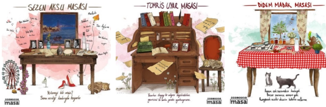
Resim 15 (Masa Dergisi İllüstrasyon Örnekleri)

Yukarıdaki illüstrasyonlar, Sezen Aksu, Tomris Uyar ve Didem Madak için çizilmiştir. İçerik gereği bu masalar ilgili kişilerin hayatlarına ve işlerine dair detaylarla doludur.