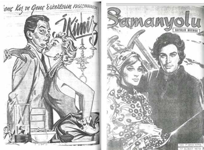
Resim 9 (1950-1980 Tarihleri Arasında Yayımlanan Süreli Yayın Örnekleri)

Cumhuriyet Kadını örneğinde; bir merdiveni anımsatan eğimli şekilde ve kalın harfler ile yazılmış Cumhuriyet kelimesi, Cumhuriyet'in yükselişini ve sağlamlığını vurguladığı söylenebilir. Bu kelimeye dayanmış, rahat bir şekilde oturan kadın illüstrasyonu ise Cumhuriyet ile kendini var eden Türk kadını simgeler. Cumhuriyet kelimesinin koyu bir şerit üzerine, kalın karakterlerle sol üstten sağ alta sayfayı ikiye bölmesi tasarıma hareket katmıştır. "Kadını" kelimesi için seçilen fontun daha zarif kıvrımlara sahip olmasının bilinçli bir seçim olduğu bellidir. Kadın illüstrasyonunun oturuş şekli ve yüzü güven duyan bir ifadeye sahiptir. Okul Kızı örneğinde de yürürken ellerindeki kitabı inceleyen iki genç kadın illüstrasyonu vardır. O harfi uzatılarak içine yerleştirilen bu kadınların olması gereken yerin okul olduğu vurgulanmıştır. Her iki dergi kapağında da tipografik çözümler vardır. Modern Türk Kadını kapağında yer alan illüstrasyon ise eğitimli Cumhuriyet kadınının şık duruşunu göstermektedir. Bu illüstrasyonun moda dergilerindeki örnekler ile benzerlik gösterdiği söylenebilir.