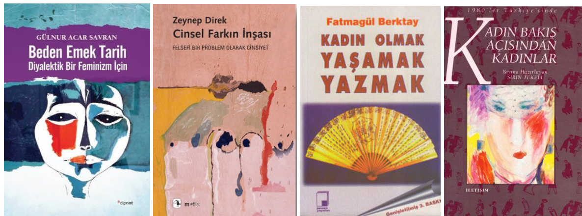
Resim 12 (Kadın Görünürlüğü Hakkında Yazılmış, Türk Kadın Yazarlara Ait Kitap Örnekleri)

Türk tarihinin en önemli kadın edebiyatçılarından biri Halide Edip Adıvar'dır. Sadece bir yazar değil aynı zamanda bir akademisyen ve siyasetçidir. Milliyetçi yazıları ve kadın karakterleri ile Edip'in Atlas yayınlarından çıkan kitaplarında illüstrasyon örneklerine rastlanır. Yukarıdaki kapaklarda yer alan illüstrasyonlarda hikayelerin kahramanları olan kadın karakterler ön plandadır. Çizimlerin düz renklerden oluşması ve siyah kontur çizgileri yayınevine ya da çizere ait bir üslubun olduğunun göstergesidir. Maksimum 4-5 farklı renk çeşidinin kullanılması dönemin baskı teknikleri ve zorlukları ile ilişkilidir.