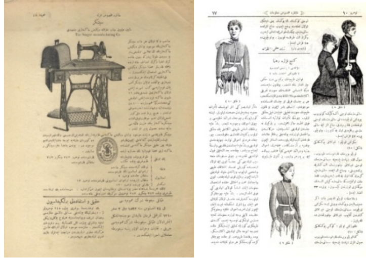
Resim 5 (Hanımlara Mahsus Gazetesi İç Sayfa Örnekleri)

Hanımlara Mahsus Gazete örneğinde dikiş makinesi ve terziilik yapan kadın illüstrasyonları görülmektedir. Kadınların üretmesi, çalışması için fayda sağlamak amacıyla çizilen bu illüstrasyonlar toplumun adım adım ilerlediğini göstermektedir. Gazete'nin 1 Eylül 1895 yayınındaki şu cümle de bu amacı vurgulamaktadır. "Gazetemizi neşretmekten asıl maksadımız menafi-i mülk-i devlete hizmet-i ciddiye ibarettir" (Art, Çakır, Demirdirek, Gençtürk, Kurç, Toska, Yılmaz, 1992: 54). Sayfa tasarımları incelendiğinde ise; dikey bir grid sistemi görülmektedir. Sol sayfada dikiş makinesinden arta kalan alan değerlendirilerek iki yana dayalı bir blok kullanılırken, alt tarafta sayfayı daha kullanışlı hale getirmek için iki bloklu bir sistem kullanılmıştır. Sağ sayfada ise sayfa dikey olarak ikiye bölünmüş, dengeli bir görsel kullanımı sağlanmıştır. Bu görselleri desteklemek adına üç blok metin iki yana dayalı şekilde yazılarak kullanışlı ve dengeli bir tasarım elde edilmiştir.