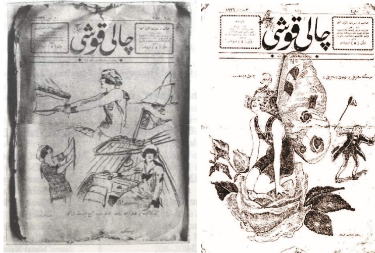
Resim 6 (Çalikuşu Dergisi Sayfa Örnekleri)

Hanımlara Mahsus Gazete örneğinde dikiş makinesi ve terziilik yapan kadın illüstrasyonları görülmektedir. Kadınların üretmesi, çalışması için fayda sağlamak amacıyla çizilen bu illüstrasyonlar toplumun adım adım ilerlediğini göstermektedir. Gazete'nin 1 Eylül 1895 yayınındaki şu cümle de bu amacı vurgulamaktadır. "Gazetemizi neşretmekten asıl maksadımız menafi-i mülk-i devlete hizmet-i ciddiye ibarettir" (Art, Çakır, Demirdirek, Gençtürk, Kurç, Toska, Yılmaz, 1992: 54). Sayfa tasarımları incelendiğinde ise; dikey bir grid sistemi görülmektedir. Sol sayfada dikiş makinesinden arta kalan alan değerlendirilerek iki yana dayalı bir blok kullanılırken, alt tarafta sayfayı daha kullanışlı hale getirmek için iki bloklu bir sistem kullanılmıştır. Sağ sayfada ise sayfa dikey olarak ikiye bölünmüş, dengeli bir görsel kullanımı sağlanmıştır. Bu görselleri desteklemek adına üç blok metin iki yana dayalı şekilde yazılarak kullanışlı ve dengeli bir tasarım elde edilmiştir.