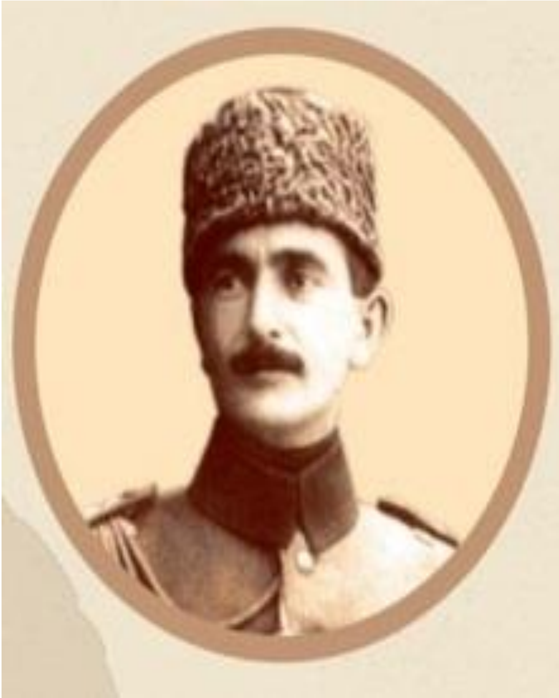
Nuri Paşa (Killigil) (1889-1949) Kafkas İslam Ordusu Komutanı