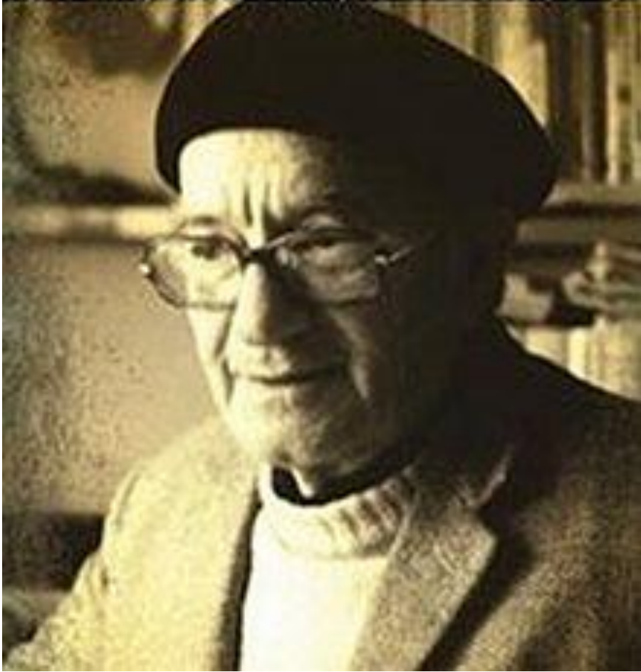
Hayatının Son Yıllarında Niyazi Berkes