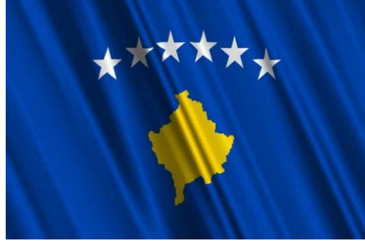
Şekil 1: Kosova Cumhuriyeti Resmi Bayrağı

Ülke dahilinde etnik olarak say olarak çoğunluk oluşturan Kosovalı Arnavutlar Arnavutluk Cumhuriyeti'nin bayrağını kullanmaktadırlar. Bu bayrak kırmızı renk üzerinde siyah renkle çizilmiş çift başlı kartaldan oluşmaktadır (Dzihat Aliju, 2018).