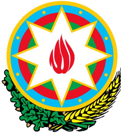
Şekil 4: Azerbaycan Cumhuriyeti Resmi Arması