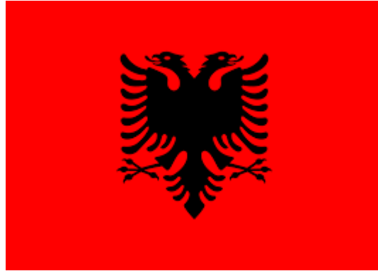
Şekil 2: Kosova Cumhuriyetinde Arnavutlar tarafından kullanılan Kosova bayrağı

Ülke dahilinde etnik olarak say olarak çoğunluk oluşturan Kosovalı Arnavutlar Arnavutluk Cumhuriyeti'nin bayrağını kullanmaktadırlar. Bu bayrak kırmızı renk üzerinde siyah renkle çizilmiş çift başlı kartaldan oluşmaktadır (Dzihat Aliju, 2018).