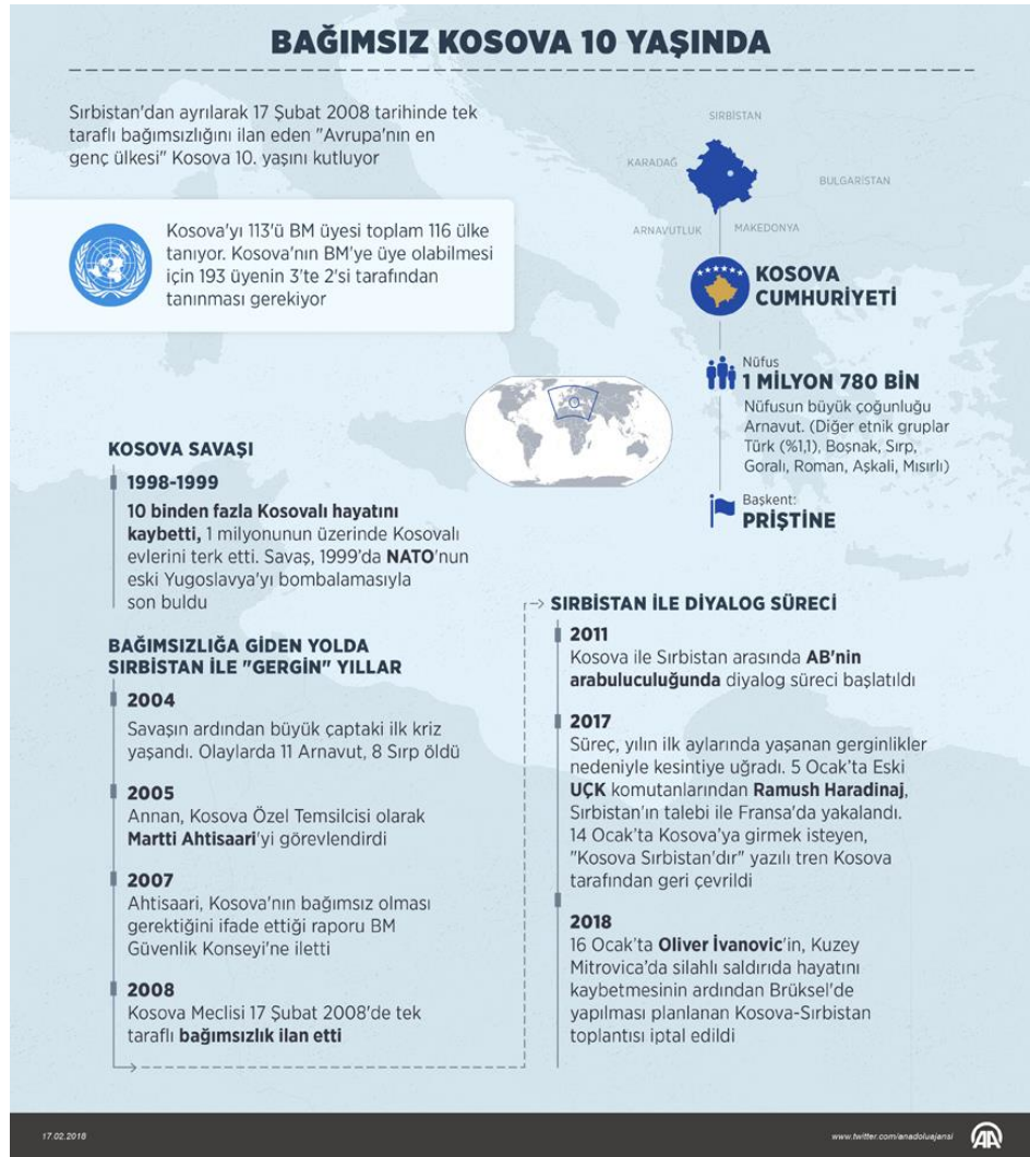
Şekil 4: Anadolu Ajans Kosova Bağımsızlığı süreci