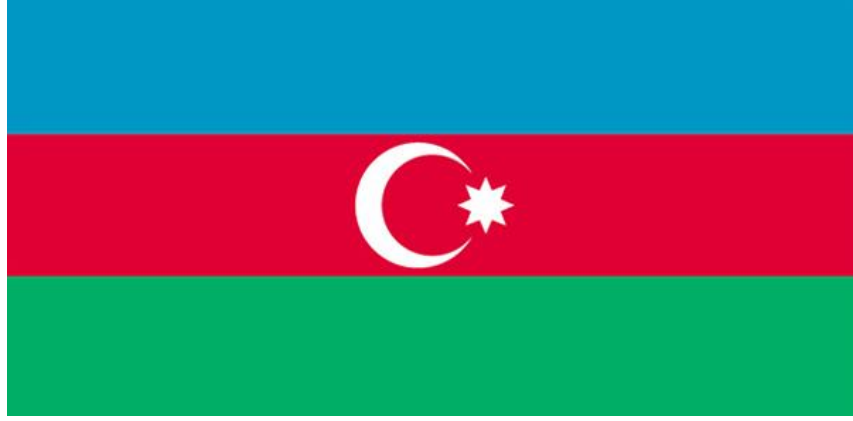
Şekil 3: Azerbaycan Cumhuriyeti Bayrağı