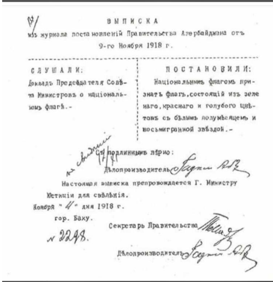
Şekil 5: Azerbaycan Halk Cumhuriyeti Bayrağı İlanı- 9 Kasım 1918 Yılı Kararı