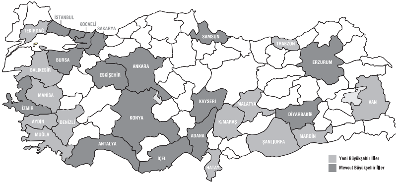
Şema 4: Türkiye – Büyükşehir İller