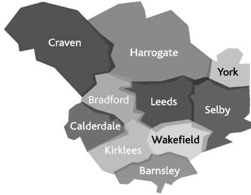
Şema 1: Leeds Kent-Bölgesi Haritası