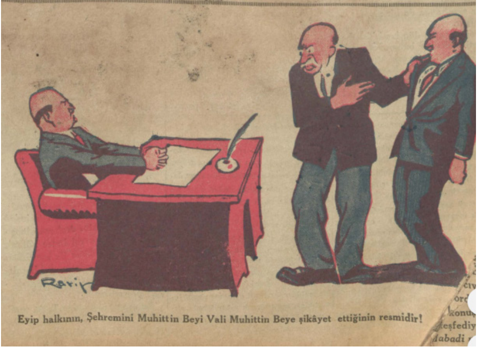
Ek-4: Valilik ve belediye reisliğinin tek elde toplanması ile ilgili basında çıkan bir karikatür 170