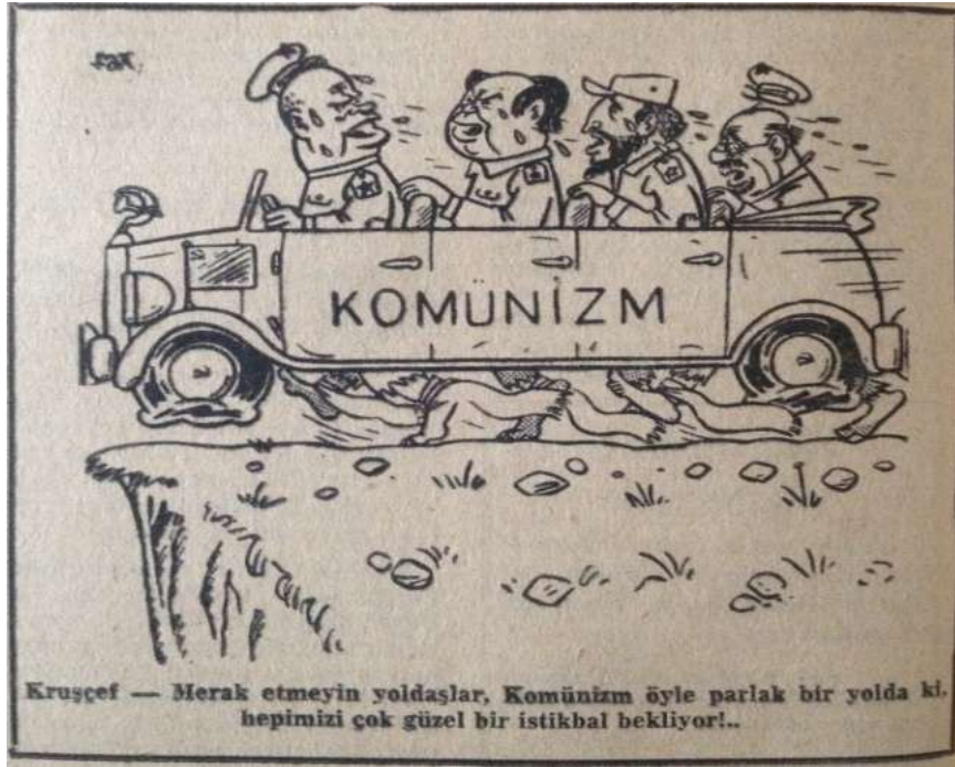
Ek-5: Komünizmin uluslararası boyutlarına bir örnek, aynı rotadaki siyasi liderler: Kruşçev, Mao, Castro...