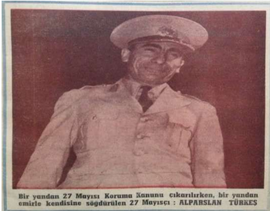
Bir yandan 27 Mayıs'ı Koruma Kanunu çıkarılırken, bir yandan emirle kendisine söğdürülen 27 Mayısçı : ALPARSLAN TÜRKES

Ek-2: MBK'nın Türkeş'i hedef almasıyla, 27 Mayıs'ın kazanımlarına zarar gelmemesi için çıkarılan Tedbirler Kanunu'nun, Türkeş'in de aslında bir 27 Mayısçı olmasıyla çeliştiği söyleniyordu.