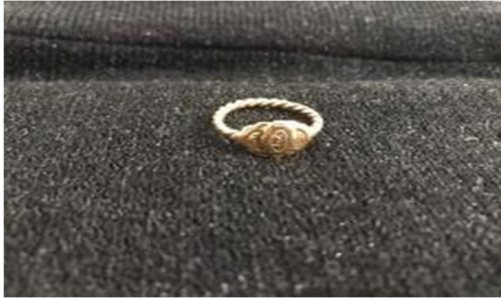
Erzurum Burması Yüzük Örneği (KK1)