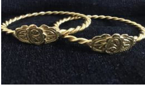
Erzurum Burması Bilezik Örneği (KK1)