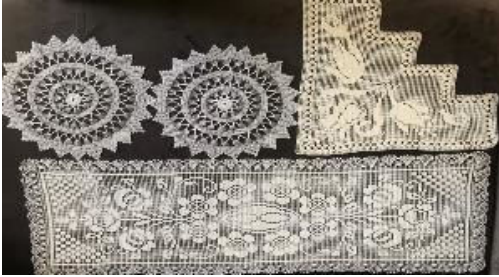
Erzurum Çeyizinden Dantel Örnekleri (KK4)