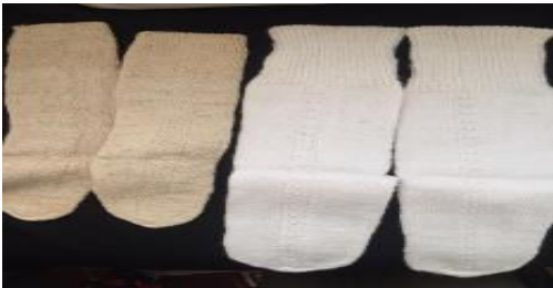
Erzurum Yöresine Ait Damat ve Kayınpeder İçin Örülen Çorap Örnekleri (KK4)