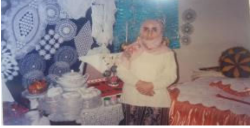
Erzurum Çeyizlerinde Dantellerin Sergilenişi (KK1)