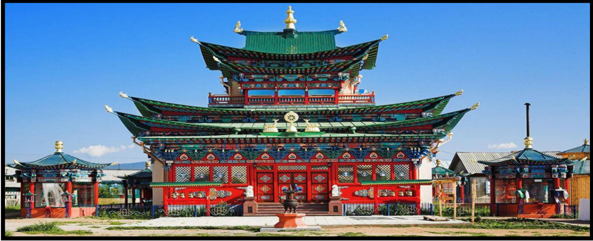
Foto 6: Buryatya'nın en ünlü Budist tapınağı olan İvolgin Budist Tapınağı (Rusça: Иволгинский дацан)