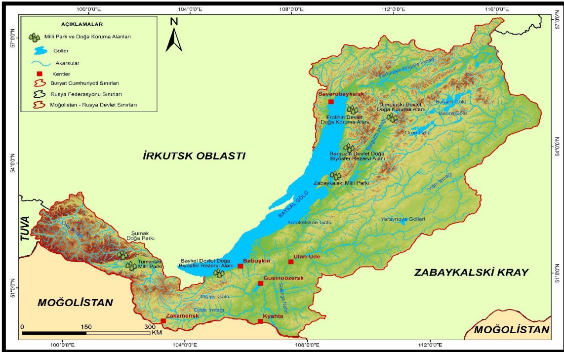
Harita 4: Buryat Cumhuriyeti Milli Parkları ve Doğa Koruma Alanları

Aşağıdaki satırlarda bu doğa koruma alanlarının coğrafi konumları, yüzölçümleri, turizm potansiyelleri, ekolojik özellikleri, kapsadıkları coğrafi unsurlar ve başlıca turistik çekicilikleri örnekler verilerek açıklanmıştır.