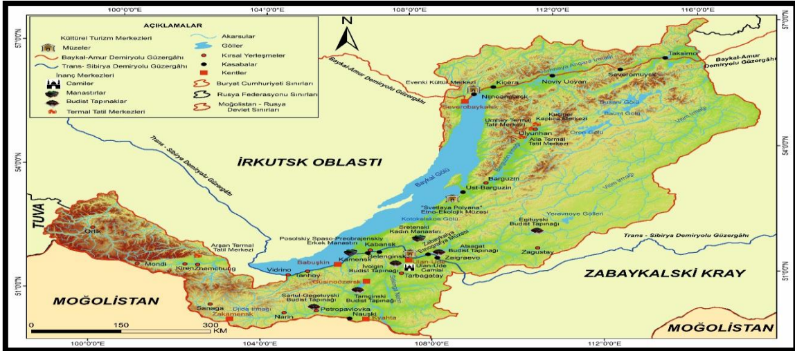
Harita 2: Buryat Cumhuriyeti Kültürel Turizm Merkezleri

Budistler ve Ortodoks Hristiyanlar Buryatya nüfusunun büyük bir bölümünü oluşturdukları için bu ülkedeki inanç merkezlerinin ve kutsal yerlerin büyük bir bölümü ya Budist ya da Ortodoks Hristiyan kökenlidirler. Kiliseler, Budist tapınakları ve manastırlar Buryat Cumhuriyeti'nde en yaygın görülen inanç turizm merkezleridir (Harita 2). Aşağıdaki satırlarda BC sınırları içinde yer alan ve hem ulusal hem de uluslararası turistik öneme sahip olan başlıca kutsal inanç yerleri ve dinsel turizm merkezleri irdelenmiştir.