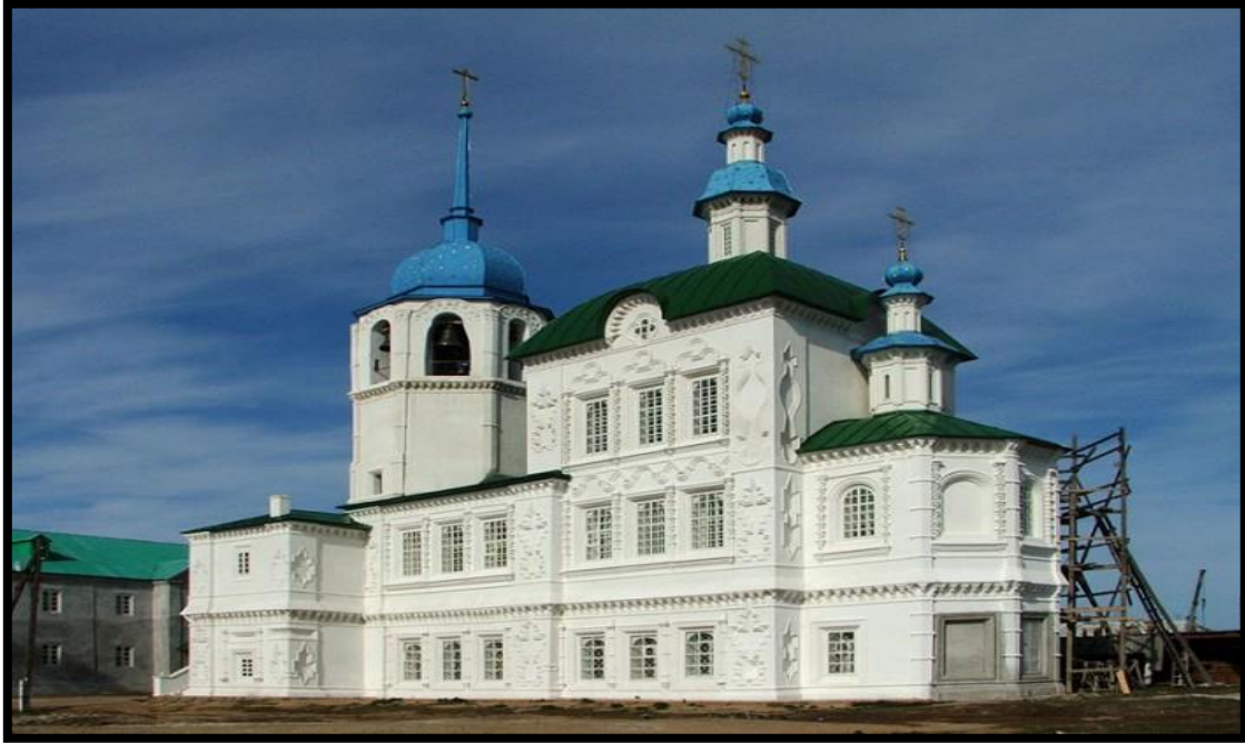
Foto 7: Buryatya'nın en eski ve en güzel Ortodoks inanç merkezlerinden birisi olan Posolskiy Spaso-Preobrajenskiy Erkek Manastırı