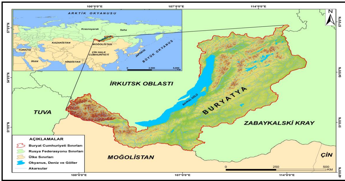
Harita 1: Buryat Cumhuriyeti Lokasyon Haritası

Buryatya hem doğal hem de beşeri turizm kaynakları bakımından zengin ve renkli bir cumhuriyettir. Yüksek dağlar, derin kanyon vadileri, volkanik araziler, körfezler, sirk gölleri, doğa koruma alanları, mağalar, adalar, plajlar, körfezler, şifalı su kaynakları, sönmüş volkanlar, buzullar ve şelaleler ülkenin başlıca doğal turizm kaynaklarını oluşturmaktadırlar. İnanç merkezleri, müzeler, tiyatrolar, etnik turizm merkezleri, sanat galerileri, kültürel ve tarihsel anıtlar, kaplıcalar ve sağlık merkezleri, Ortodoks kiliseleri ve Budist tapınakları, kent meydanları ve kaleler ülkenin başlıca beşeri turizm kaynaklarını oluşturmaktadırlar. Yabancı turistler için Buryatya, Baykal Gölü kıyılarını, Selenga Vadisini, tarihi