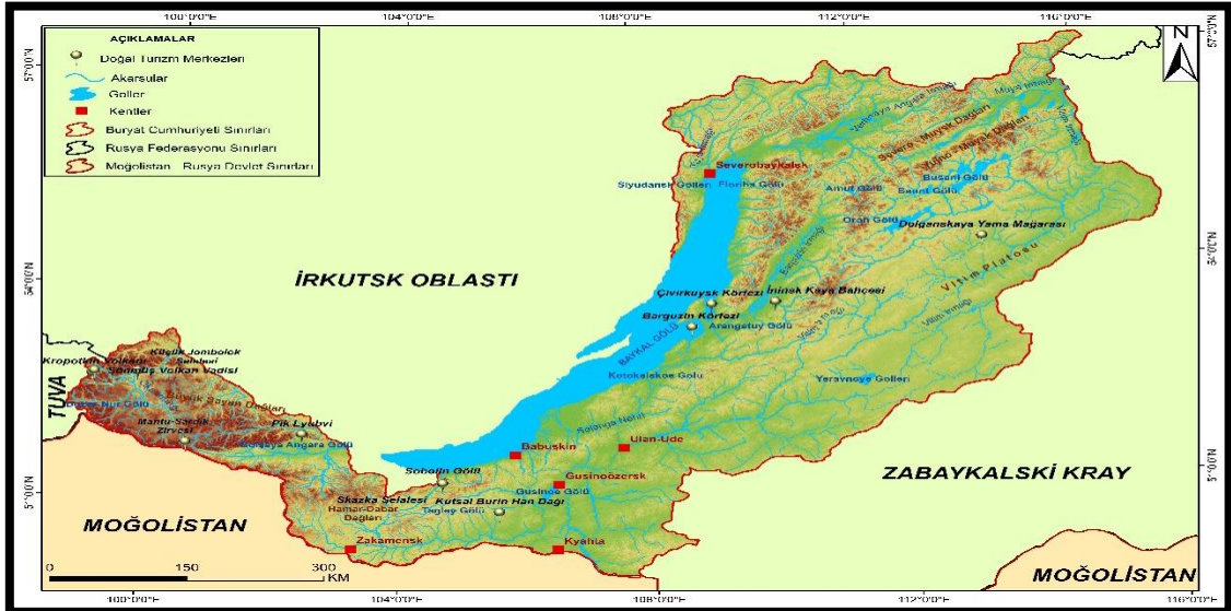
Harita 3: Buryat Cumhuriyeti Doğal Turizm Merkezleri

Jeomorfolojik ve hidrografik çekicilikler, şelaleler, göller, kanyon vadileri, sulak araziler, plajlar, adalar, körfezler, mağaralar, ormanlık araziler, akarsu vadileri ve volkanik araziler, BC’inde en yaygın görülen doğal turizm çekicilikleridir. Aşağıdaki satırlarda Buryatya sınırları içinde yer alan başlıca doğal turizm merkezlerinin coğrafi konumu, başlıca özellikleri ve turizm potansiyeli örnekler verilerek irdelenmiştir.