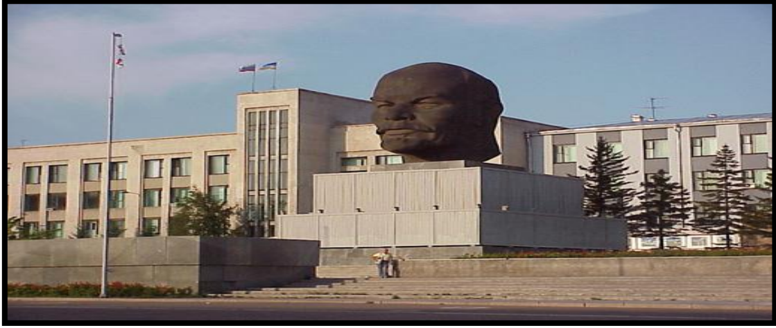
Foto 8: Ulan-Ude Kentinde Yer Alan Dünya'nın en büyük Lenin Kafa Heykeli (Anıtı)