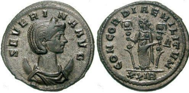
Resim 3) Ön yüzünde “SEVERINA AVGV”, arka yüzünde “CONCORDIAE MILITIVM” lejantının yer aldığı Severina dönemi sikkesi için bkz.

http://www.wildwinds.com/coins/ric/severina/RIC_0004.jpg (Erişim Tarihi: 30.05.2021)