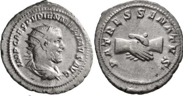
Resim 1) Ön yüzünde “IMP CAES M CLOD PVPIENVS AVG”, arka yüzünde “PATRES SENATVS” lejantının yer aldığı Maximus Pupienus’a ait sikke için bkz. https://www.wildwinds.com/coins/sear5/s8521.html (Erişim Tarihi: 18.05.2021)