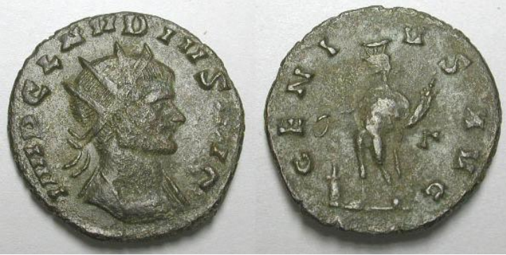
Resim 2) Ön yüzünde “IMP CLAVDIVS AVG”, arka yüzünde “GENIVS AVG” lejantının yer aldığı Claudius Gothicus dönemi sikkesi için bkz. https://www.wildwinds.com/coins/ric/claudius_II/RIC_0046.jpg (Erişim Tarihi: 30.05.2021)