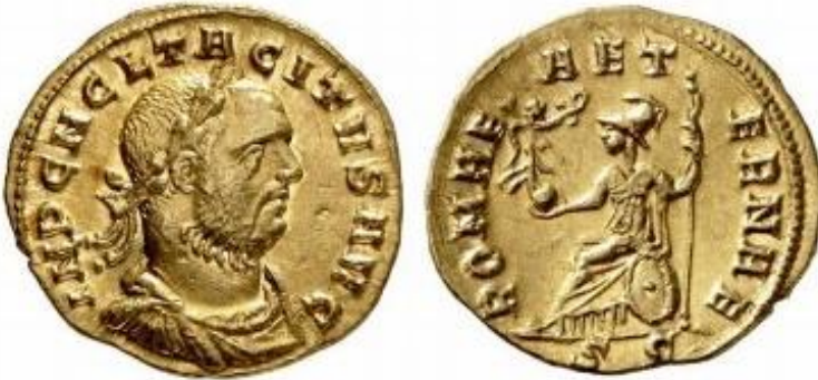
Resim 4) Tacitus döneminde çıkarılan ve arka yüzünde “ROMAE AETERNAE” lejantının yer aldığı Roma figürünün hemen altında senatus consulto lejantını temsil eden SC işaretli sikke örneği için bkz.

http://www.wildwinds.com/coins/ric/severina/RIC_0004.jpg (Erişim Tarihi: 30.05.2021)