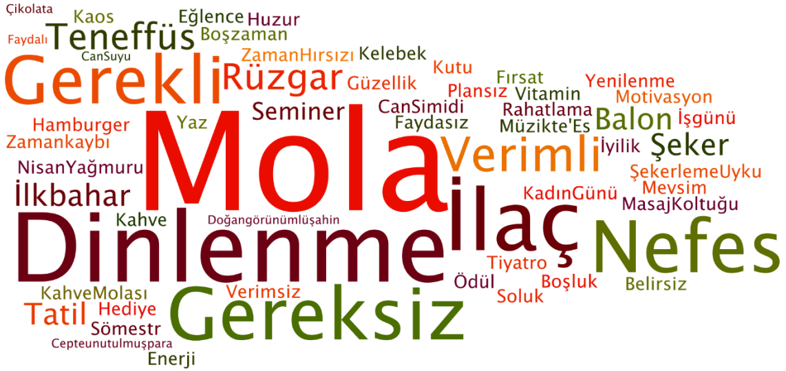
Şekil 2. Ara Tatil Kavramsal Metaforlarına İlişkin Kod Peyzajı

Ara tatile ilişkin metaforların ve kavramsal kategorilerin yer aldığı Ek-1 incelendiğinde, aynı metaforun farklı kategorilerde yer aldığı görülmektedir. Bunun nedeni, metaforların katılımcıların ara tatile ilişkin oluşturduğu mecazi imge açıklamalarına göre kategorilere dahil edilmesidir. Ayrıca metaforların genel tekrar edilme sıklığını görebilmek amacıyla, frekanslara göre kod haritalama (kod peyzajı) oluşturan Wordle yazılım programı kullanılmıştır. En az iki frekansa sahip kavramsal metaforlardan ortaya çıkan kod peyzajı Şekil 2’de gösterilmektedir.