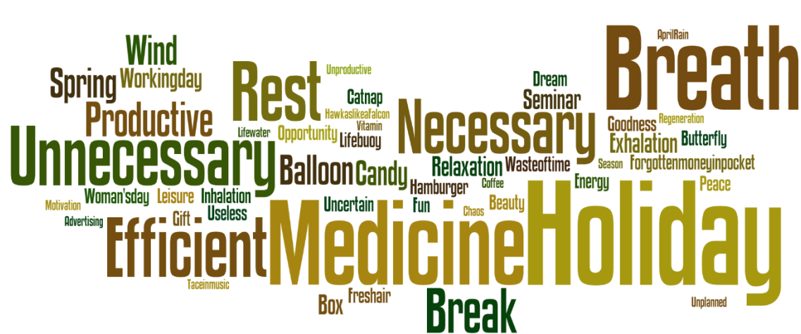
Figure 2. The Code Mapping for Midterm Break Conceptual Metaphors

When Appendix-1, which includes the metaphors and conceptual categories regarding the midterm holiday, was examined, it was seen that the same metaphor was included in different categories. The reason was that the metaphors were categorized according to the metaphors of the participants' explanations regarding the midterm break. In addition, Wordle software program, which created code mapping (code landscape) according to frequencies, was used in order to see the general frequency of repetition of metaphors. The code landscape emerging from conceptual metaphors with at least two frequencies is shown in Figure 2.