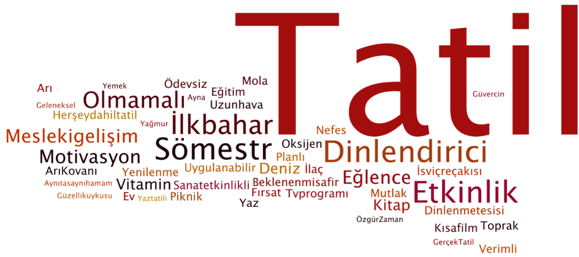
Şekil 3. İdeal Ara Tatil Metaforlarına İlişkin Kod Peyzajı

Ek-2’de görüleceği üzere 412 katılımcıya ait birbirinden ayrı anlamda kullanılan 310 adet mecazi imge, ideal metafor kategorilerine dahil edilmiştir. Gerçek ara tatil (n=73) ve motive eden ara tatil (n=69), en sık frekansa sahip ideal kategorilerdir. Bunun yanında farklı ideal metaforların genel tekrar edilme sıklığını görebilmek amacıyla, en az iki frekansa sahip ideal metaforların Wordle programına aktarılmasıyla ortaya çıkan kod peyzajı Şekil 3’te görülmektedir.