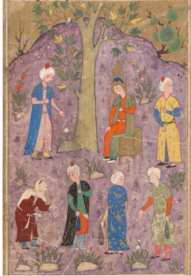
Resim 7: Hz. Yusuf'un Köle Pazarında Satılması