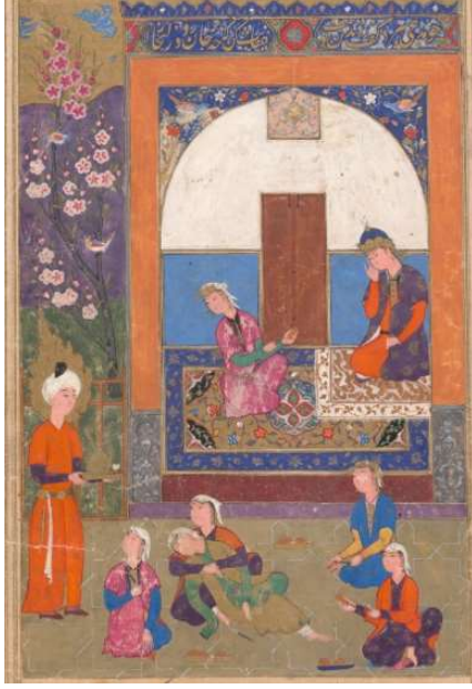
Resim 9: Hz. Yusuf'un Güzelliğinden Etkilenen Kadınların Ellerini Kesmesi