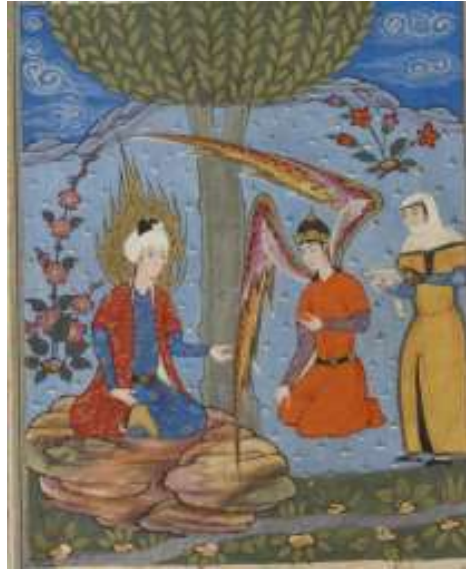
Resim 20: Kazvin Dönemi Minyatür Örneği