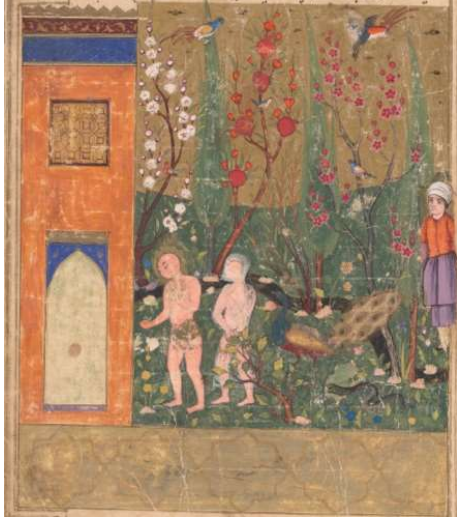
Resim 1: Meleklerin Hz. Âdem'e Secde Etmesi