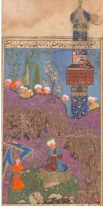
Resim 5: Hz. İbrahim'in Ateşe Atılması