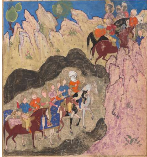
Resim 12: Hz. Musa'nın İsrailoğulları ile Kızıldeniz'i Geçmesi