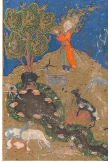
Resim 10: Hz. Musa'nın Sina Dağı'nda Allah ile Konuşması