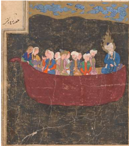
Resim 3: Nuh Tufanı