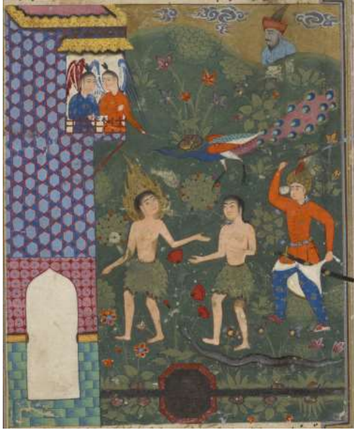
Resim 21: Hz. Âdem ve Havva'nın Cennetten kovulması Kazvin Okulu Minyatür Örneği XVI. Yüzyıl