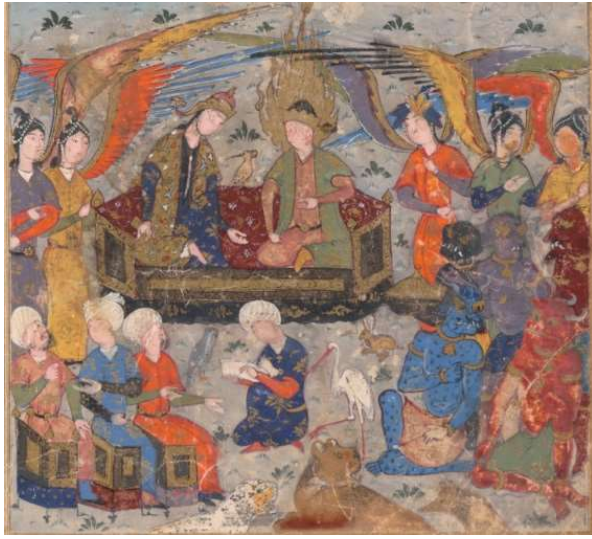
Resim 14: Hz. Süleyman ve Sebe Melikesi Belkıs