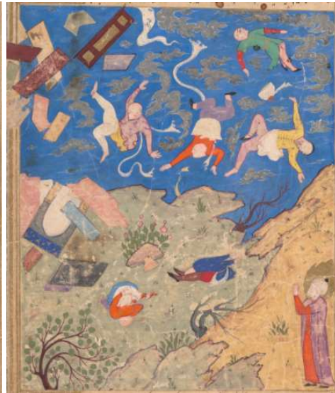
Resim 4: Ad Kavminin Helak Olması