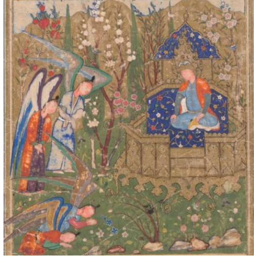
Resim 2: Hz. Âdem ve Havva'nın Cennetten Kovulması