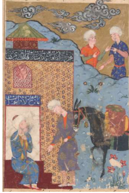
Resim 18: Hz. Üzeyr'in Öldükten Sonra Dirilip Köyüne Geri Dönmesi