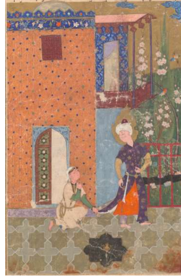
Resim 8: Hz. Yusuf'un Züleyha'nın Evinden kaçarken Gömleğinin Yırılması