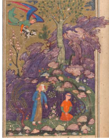
Resim 6: Hz. İbrahim'in İsmail'i Kurban Etmesi