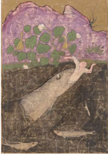
Resim 13: Hz. Yunus'un Balığın Karnından Çıkarılması