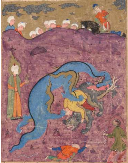
Resim 11: Hz. Musa'nın Asasını Ejder'e Çevirmesi