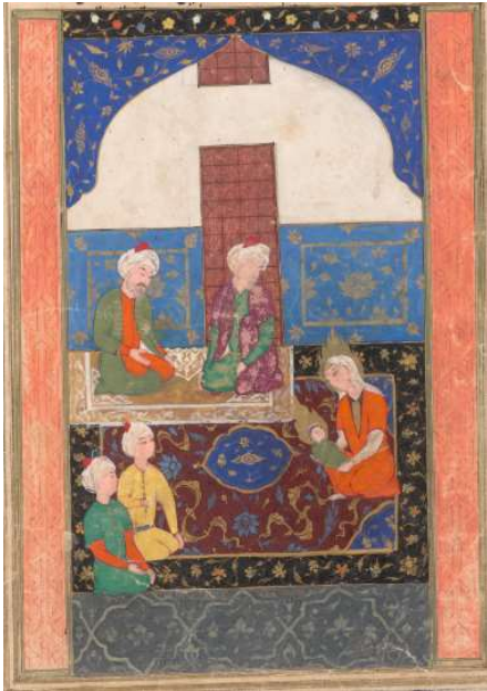
Resim 15: Hz. İsa'nın Kundaktayken Konuşması