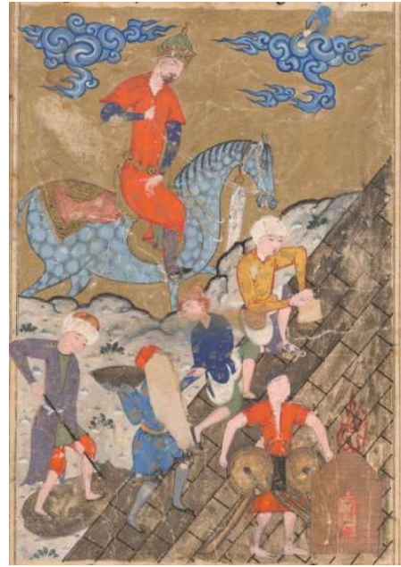
Resim 16: Hz. Zulkarney'in Yecüc ve Mecüc Kavmine Karşı Duvar Ördürmesi