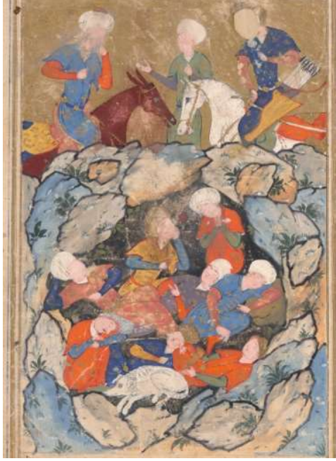
Resim 17: Ashab'ı- Kehf