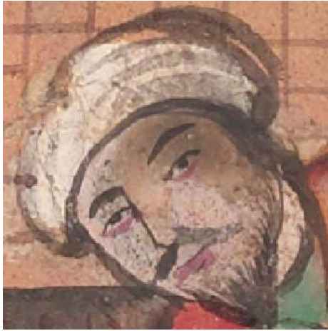
Resim 19: Hatalı Onarım Sonrası Yüz Hatları