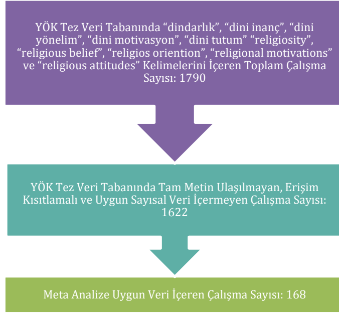
Şekil1. Akış Diyagramı.

Meta analize dâhil edilen çalışmaların seçilme sürecine ilişkin akış diyagramı aşağıda verilmiştir: