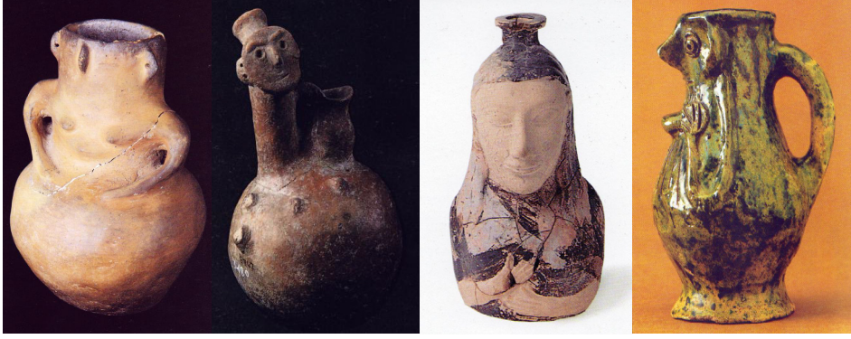
Resim 1: Kadın biçimli çömlek M.Ö. 6.000(1), Kadın biçimli çömlek M.Ö. 3.000(2), İnsan biçimli riton M.Ö. 6.yy.(3), İnsan biçimli sürahi M.S. 14-15.yy (Er, 2011, s.16-19)

hayvanlara, nesnelere vb. canlı-cansız pek çok varlığa aktarıldığı salt antropomorfik seramikler; yüzyıllar hatta binyıllar boyunca önemli değişimler göstermeden, belirli bir eksen etrafında oluşturulmuştur.