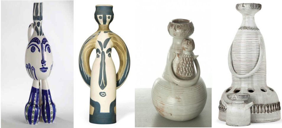
Resim 2: Pablo Picasso(1, 2) ve Jacques Pouchain(3, 4)'in antropomorfik seramik eserlerinden örnekler

Pablo Picasso, Jacques Pouchain gibi sanatçılara ait 20. yüzyıl ortalarında üretilen, insan biçimi atfedilen seramik objelerin/eserlerin, ilgili konuda geçmiş ve günümüzü bağdaştıran bir köprü niteliğinde olduğu, çağdaş antropomorfik seramikler anlamında öncü eserler olarak kabul edilebileceği söylenebilir.