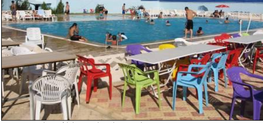
Foto: 2. Karakoçan'daki yarı olimpik yüzme havuzu.

Kaymakamlık tarafından yapılan bu yüzme havuzu özele devredilmiştir. Özellikle yaz aylarında yüzme havuzuna halkın büyük ilgisi vardır.