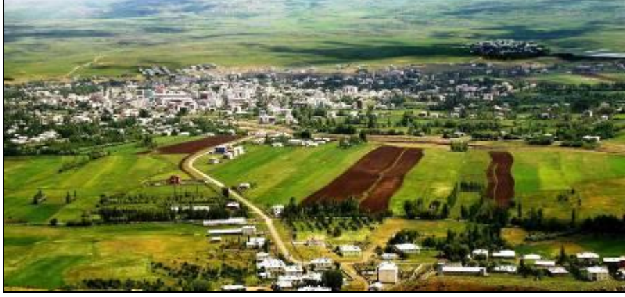
Foto 1: Karakoçan Şehri'nden genel bir görünüm: Karakoçan'da verimli tarım arazileri üzerinde son derece hızlı bir yapılaşma vardır.

İlk Kuruluş ve 1936 Yılına Kadar Olan Gelişme Dönemi: Tepe Köyü ile başlayan tarihi tam olarak bilinmemekle birlikte, yapılmış araştırma sonuçlarına göre bu yerleşme yeri sırasıyla Hititler, Urartular, Medler, Persler ve Sasaniler'in egemenliğine girmiştir (Yeni Bin Yılda Karakoçan, 2002). İslam orduları Hz. Ömer devrinde bölgeye kadar gelmiştir. 1071 Malazgirt Meydan Savaşı'ndan sonra yerleşme Türklere bağlanmıştır. Daha sonra sahada Akkoyunlular ve Safeviler uzun süre hâkimiyet sürmüştür, Çaldıran Savaşı'ndan (1514) sonra Osmanlı egemenliğine girmiştir. Karakoçan'ın çekirdek kısmına karşılık gelen sahada yaptığımız incelemeler neticesinde çok sayıda tarihî kalıntı ve harabelere rastlanmıştır.