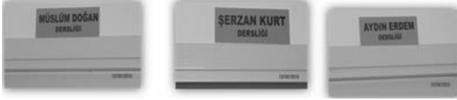
Şekil 3. Siyaset Akademisi derslik tabelaları örneği.