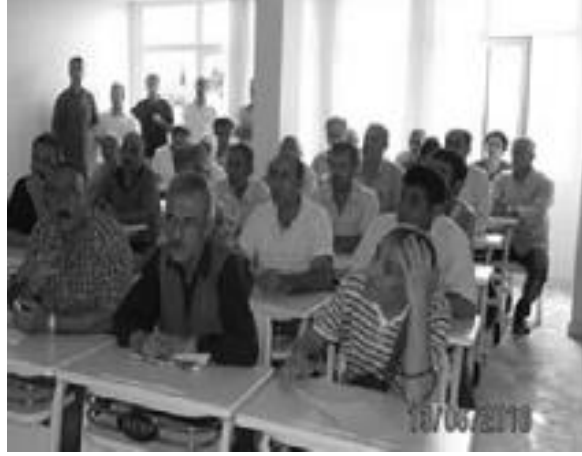
Şekil 2. Siyaset Akademisi sınıfı.

belirtilen halk dönüşümü ve ideolojik sahiplenmeyi gerçekleştirecek lider insan kaynaklarını yetiştirmek için, Abdullah Öcalan'ın talimatı doğrultusunda kurulmuştur (TMU1; TMU2; TMU3; TMU4; TMU5; Fırat Haber Ajansı, 2010).