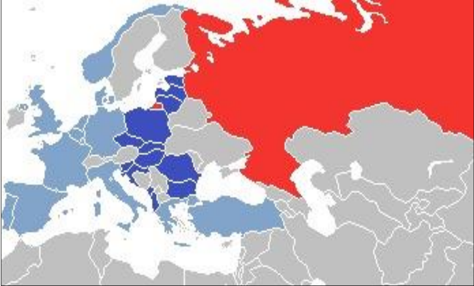
Harita 3 : Varşova Paktı'ndan NATO'ya katılan ülkeler

Soğuk Savaş'ın son bulması ile yeni oluşan düzeni yorumlamak amacıyla çeşitli kuramlar geliştirilmiştir. Huntington tarafından öngörülen bir "medeniyetler savaşı" ile yeni dünyanın rakip medeniyetlere bölünmüş