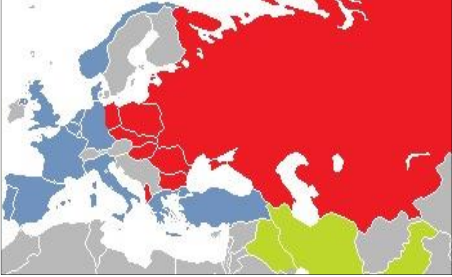
Harita 2 : NATO, CENTO ve Sovyetler Birliđi