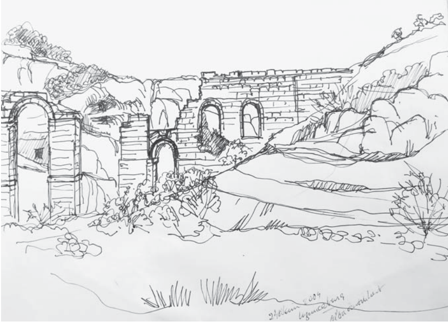
Olba Su Kemerı Cavidan Yegül Erten Kağıt Üzerine Çini Mürekkebi Eskiz