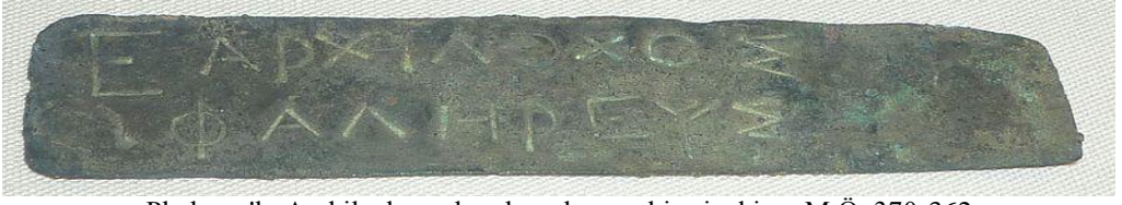
Phaleron'lu Archilochos adına hazırlanmış bir pinakion, M.Ö. 370-362 British Museum collection.