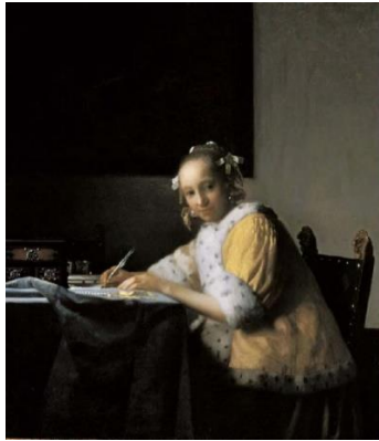
Görsel 13. Johannes Vermeer, Mektup Yazan Kadın, T.Ü.Y.B., 45x39.9 cm, 1665, National Gallery of Art, Washington

Kısaca kompozisyon kurgusundan bahsettikten sonra, resmin günlük yaşamla ilişkisine değinmek gerekirse, sanatçının Görsel 13'de yer alan "Mektup Yazan Kadın" isimli eserine bakılabilir. Bu eserde sevgilisine mektup yazan bir kadın yer almaktadır ve kadının düşünceli görünümünün altında yatan sebebin de bu aşk mektubu olduğu söylenebilir. Bu resimden yola çıkarak söylenebilecek bir önemli nokta da Vermeer'in resimlerinde betimlenen günlük yaşamın, eylem ve iç gözlem arasında bir yerde durduğudur (Brenner, Riddell, & Moore, 2007: 84).