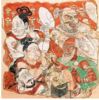
Görsel 8. Müzisyenler, Uygur Dönemi, 10-11. yüzyıl dolayları, 106.5x 106.5 cm, Tokyo National Museum, Tokyo

Resimde figür kullanmanın yasak olduğu İslam sanatında dahi günlük yaşam konulu çalışmalar görmek mümkündür. Ürdün’de bulunan halifelik sarayının duvarlarındaki resimler bu durumun örneklerindedir (bkz. Görsel 9). İngiliz yazar Mary Hollingsworth (2009: 117), dini ve resmi olmayan bu yapının duvarlarına, bir hanedan prensinin boş zamanlarında yaptığı etkinlikler, avlanma ve müzik sahnelerinin resimlendiğini söyleyerek, bu resimlerin günlük yaşamla olan ilişkisini açıkça ifade etmiştir. 1254-1324 yılları arasında yaşamış ressam Zhao Mengfu’nun Görsel 10’da yer alan “Yıkanan Atlar” isimli çalışması ise günlük yaşam bağlamında Çin sanatından bir örnek olarak gösterilebilir.