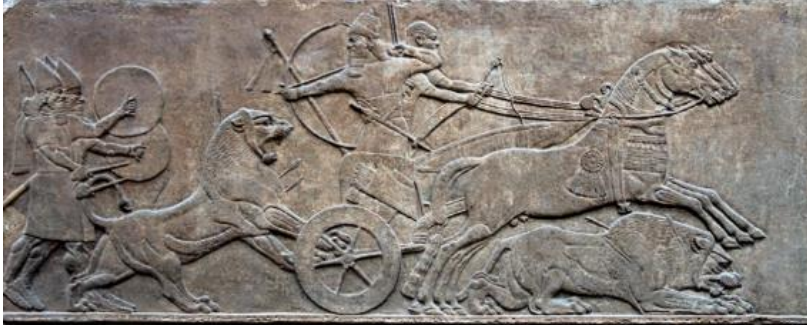
Görsel 3. Aslan Avı, M.Ö. 850 dolayları, The British Museum, Londra

Asur sanatından bir örneğin yer aldığı Görsel 3'te aslanların avlandığı bir sahne görülmektedir. Bu örnekten yola çıkarak Asur sanatında ve Mısır sanatında kullanılan hayvan figürlerinin net bir şekilde birbirinden ayrıldığı sonucuna varılabilir (bkz. Görsel 2 ve 3). Hayvan yetiştiricisi olan Mısırlılar kendi insanını evcil hayvanlarla birlikte resmederken, Asurlular ilkel insanın yaptığı gibi daha çok avlanırlardı ve hayvanlara karşı vahşi bir tutum içerisindeydiler. Bu sebeple, Görsel 2 ve 3'te yer alan iki farklı avlanma sahnesi, ait oldukları toplumların günlük yaşamlarındaki ayrılığı da doğrudan göstermektedir.