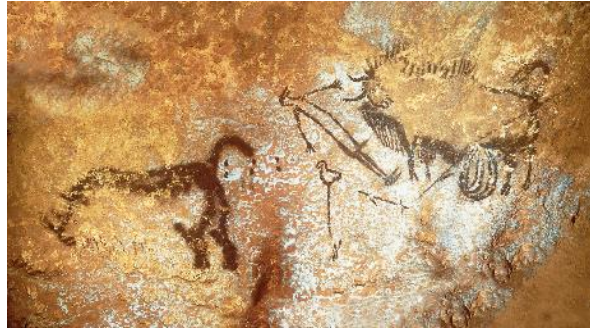
Görsel 1. Kuş Maskeli Adam, Bizon ve Gergedan, M.Ö. 15000-13000, Lascaux mağarası, Fransa

İnsanoğlunun ilk sanatsal tecrübelerinden günümüze kadar hemen her dönem, günlük yaşam konulu betimlemelere rastlamak mümkündür. Mağara duvarlarına yapılan resimler bu anlamda değerlendirebileceğimiz ilk örneklerdendir. Bu örneklere bakıldığında, ilkel insanın kendi yaşamsal sürecinin içerisinde yer alan olayları ele aldığı ve bu olayları mağara duvarlarına resmettiği görülür. Bu resimlerden biri olan kuş maskeli adam, bizon ve gergedanın bir av sahnesi içerisinde resimlendiği mağara resmi, günlük yaşamın betimlendiği en eski örneklerdendir (bkz. Görsel 1).