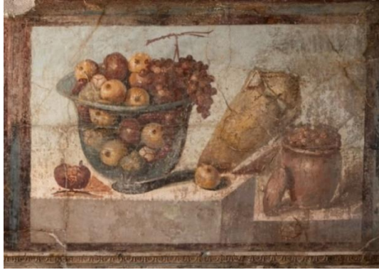
Görsel 5. Pompei'den Duvar Resmi, 100x234 cm, M.Ö. 50-79, Naples National Archaeological Museum, İtalya

Görsel 6'da yer alan çalışma ise Mısır'da ölülerin mezarlarına konmak üzere yapılmış olan fayyum portrelerinden biridir. Kentlerde yaşayan orta sınıfa ve sıradan insanlara ait bu portreler, canlı ve gerçekçi görünmelerinin yanında modelin bireysel özelliklerini ayrıntılı biçimde gösteren çalışmalardır. Portre türünde yapılan bu resimlerden bazıları ölen kişinin günlük yaşamını hatırlatan sahneler içermektedir (bkz. Görsel 6).