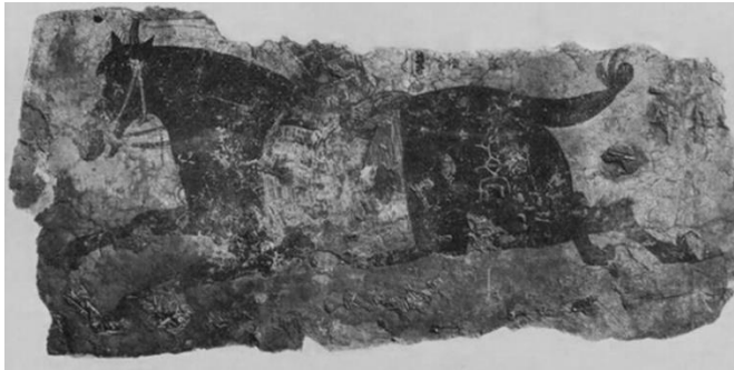
Görsel 7. Dört Nala Koşan At, Uygur Freski, 66x32cm, 8-9. yy dolayları, Hoço

Türk resminin bilinen en eski örnekleri, çoğunlukla Budist ve Maniheizt inanışların yansıtıldığı Uygur duvar resimleri ve minyatürlerdir. Bu resimlerde portreler, müzisyenler, hayvan tasvirleri gibi din dışı konular da resmedilmiştir. Görsel 7’de görülen “Dört Nala Koşan At” isimli duvar resmi günlük yaşamda rastlanabilecek bir sahneyi göstermektedir. Sanat tarihçisi Oktay Aslanapa, bu resim hakkında “Atın başı, gözlerin başarılı deseni ile çok canlı bir ifade kazanmış, kuyruk da düğümlenmiştir” (Aslanapa, 1989: 17) ifadelerini kullanarak resmin gerçekliğe bağlı kalınarak yapıldığından bahseder. Ayrıca kuyruğu düğümlü olarak betimlenen at, Türk kültüründe yer alan bir geleneği göstermesi sebebiyle döneminin kültürünü yansıtmaktadır. Görsel 8’de yer alan ve müzisyenlerin betimlendiği minyatür resmi de din dışı bir konu olarak gündelik hayat bağlamında değerlendirilebilir.