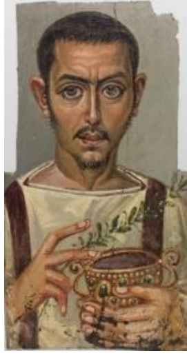
Görsel 6. Kupalı Adamın Mezar Portresi, Ahşap Üzerine Mum Boya, 42.7x 23 cm, M.S. 225-250, Louvre Abu Dhabi, Birleşik Arap Emirlikleri

Türk resminin bilinen en eski örnekleri, çoğunlukla Budist ve Maniheizt inanışların yansıtıldığı Uygur duvar resimleri ve minyatürlerdir. Bu resimlerde portreler, müzisyenler, hayvan tasvirleri gibi din dışı konular da resmedilmiştir. Görsel 7’de görülen “Dört Nala Koşan At” isimli duvar resmi günlük yaşamda rastlanabilecek bir sahneyi göstermektedir. Sanat tarihçisi Oktay Aslanapa, bu resim hakkında “Atın başı, gözlerin başarılı deseni ile çok canlı bir ifade kazanmış, kuyruk da düğümlenmiştir” (Aslanapa, 1989: 17) ifadelerini kullanarak resmin gerçekliğe bağlı kalınarak yapıldığından bahseder. Ayrıca kuyruğu düğümlü olarak betimlenen at, Türk kültüründe yer alan bir geleneği göstermesi sebebiyle döneminin kültürünü yansıtmaktadır. Görsel 8’de yer alan ve müzisyenlerin betimlendiği minyatür resmi de din dışı bir konu olarak gündelik hayat bağlamında değerlendirilebilir.