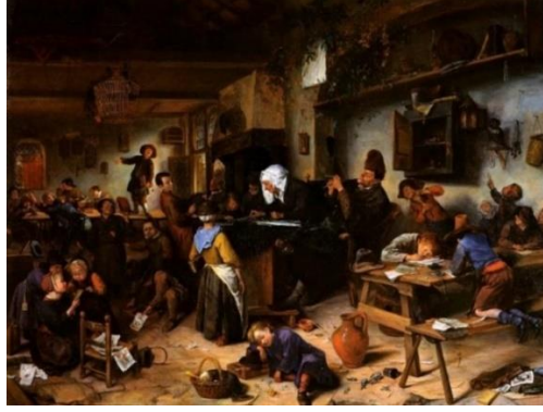
Görsel 15. Jan Steen, Erkek ve Kız Okulu, T.Ü.Y.B., 81.7x108.6 cm, 1670, National Galleries of Scotland, İskoçya