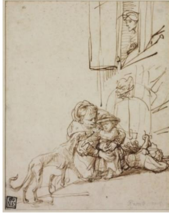
Görsel 12. Harmenszoon van Rijn Rembrandt, Çocuk Tutan Kadın, Kâğıt üzerine kalem ve kahverengi mürekkep, 18.2x14.5 cm, 1635-6, Museum of Fine Arts, Budapeşte

17. yüzyıl Hollanda'sında janr resmi başlığı altında değerlendirilebilecek eserlerin başında, günlük yaşam konulu iç mekân resimleri gelmektedir. Bu türde eser veren sanatçıların en bilinenlerinden biri Johannes Vermeer'dir. Usta sanatçı, orta sınıftan kişilerin konutlarının iç mekânlarına çoğu zaman tek, bazen de iki ya da üç figür yerleştirerek kompozisyonlarını oluşturur. Günlük yaşamın sıradanlığı içerisinde resmedilen bu figürler, Rembrandt'ın resimlerindeki gibi resmin ana elemanı olarak değil, adeta mekânın birer parçası olarak kompozisyonlarda yer alır.