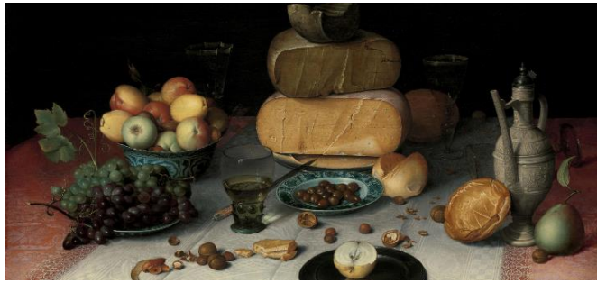
Görsel 17. Floris Claesz van Dijck, Peynirli Natürmort, A.Ü.Y.B, 82.5x111.4 cm, 1615, Rijksmuseum, Amsterdam

Konu temelli bir yaklaşım olan janr resmi, sadece içerisinde insan figürü bulunan resimleri kapsamaz. En basit tanımıyla, cansız nesne ya da nesnelere oluşan natürmortlar da bu resim türüne örnek gösterilebilir. Özellikle bu resim türünün İngilizcede karşılığı olan “still life” terimini oluşturan kelimelerin anlamı (still: durağan, life: yaşam), bu resmin gündelik hayat ile olan ilişkisini gözler önüne serer. Bu noktada, natürmortun janr resmi ile ilişkisinin kurulabilmesi için portredeki ayrıma benzer bir sınıflandırma yapılması gerekmektedir. Bu sınıflandırmada önemli olan, resimdeki elemanların bir araya gelmesindeki yaklaşımın doğal, günlük yaşam içerisinde rastlanılabilir olmasıdır. Natürmortlarıyla tanınan, Hollandalı ressam Floris Claesz van Dijck’e ait “Peynirli Natürmort” isimli eser, bu bağlamda değerlendirilebilecek bir natürmorttur ve bu çalışma 17. yüzyıl Hollanda’ında herhangi bir yemek masasında rastlanılabilir bir sahne içermesi sebebiyle doğrudan bir janr resmi örneğidir (bkz. Görsel 17).