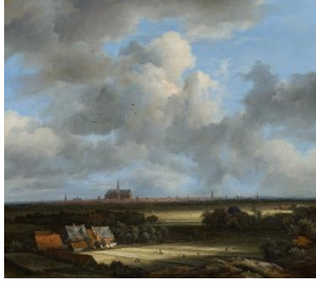
Görsel 18. Jacob van Ruisdael, Ağartma Tarlalarıyla Harlem Manzarası, T.Ü.Y.B. 55.5 x 62 cm, 1670-5, Museum Mauritshuis, Den Haag