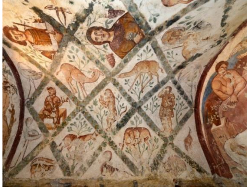
Görsel 9. Duvar Resimleri, M.S.730 dolayları, Kuseyr Amra, Ürdün