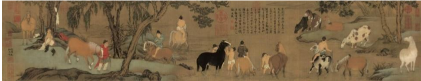
Görsel 10. Zhao Mengfu, Yıkanan Atlar, İpek Üzerine Mürekkep Ve Renk, 28.1x155.5 cm, Palace Museum, Pekin