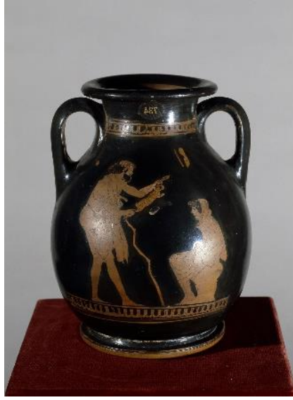
Görsel 4. Genç Tavşan Uzatan Yaşlı Adam, Kırmızı Figürlü Pelike, M.Ö. 470, Hermitage Museum, Rusya