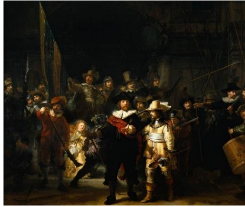
Görsel 11. Harmenszoon van Rijn Rembrandt, Gece Devriyesi, T.Ü.Y.B. 379.5x453.5 cm, 1642, Rijksmuseum, Amsterdam