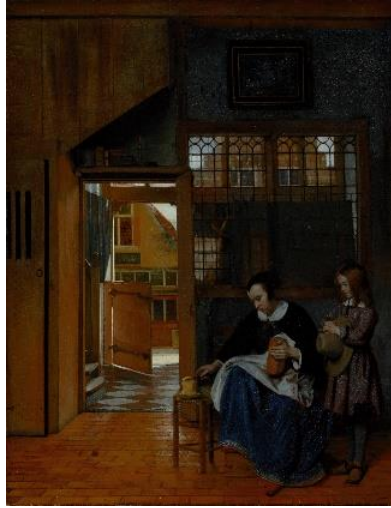
Görsel 14. Pieter de Hooch, Çocuğuna Ekmek ve Yağ Hazırlayan Kadın, T.Ü.Y.B., 68.6x53.3 cm, 1660-3, Getty Center, Los Angeles

Janr resminin önde gelen ressamlarından olan Jan Steen'in eserleri, Vermeer ve Hooch'un resimlerinin durağan yapısının aksine, dinamik bir yapıya sahiptir. Meyhane kavgalarından zarif ev içi mekânlarına kadar uzanan bir konu çeşitliliğine sahip olan bu resimler, Görsel 15'te de görüldüğü üzere, hikâye anlatımında taşıdığı mizahi unsurlar sebebiyle janr resminin öncü sanatçılarından Pieter Brueghel'in resimlerini anımsatır (Janson, 1991: 580).