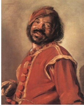
Görsel 16. Frans Hals, Melez, T.Ü.Y.B, 72 x 57.5 cm, 1628–30, Museum der Bildenden Künste, Leipzig

Konu temelli bir yaklaşım olan janr resmi, sadece içerisinde insan figürü bulunan resimleri kapsamaz. En basit tanımıyla, cansız nesne ya da nesnelere oluşan natürmortlar da bu resim türüne örnek gösterilebilir. Özellikle bu resim türünün İngilizcede karşılığı olan “still life” terimini oluşturan kelimelerin anlamı (still: durağan, life: yaşam), bu resmin gündelik hayat ile olan ilişkisini gözler önüne serer. Bu noktada, natürmortun janr resmi ile ilişkisinin kurulabilmesi için portredeki ayrıma benzer bir sınıflandırma yapılması gerekmektedir. Bu sınıflandırmada önemli olan, resimdeki elemanların bir araya gelmesindeki yaklaşımın doğal, günlük yaşam içerisinde rastlanılabilir olmasıdır. Natürmortlarıyla tanınan, Hollandalı ressam Floris Claesz van Dijck’e ait “Peynirli Natürmort” isimli eser, bu bağlamda değerlendirilebilecek bir natürmorttur ve bu çalışma 17. yüzyıl Hollanda’ında herhangi bir yemek masasında rastlanılabilir bir sahne içermesi sebebiyle doğrudan bir janr resmi örneğidir (bkz. Görsel 17).