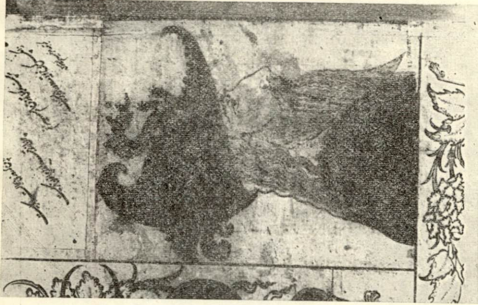
a. VII. Johannes Paleologos'un portresinden mülhem bir gravür

( Topkapı Sarayı Müzesi Hazine Ktb. 2153 Nu. 11 albümden )