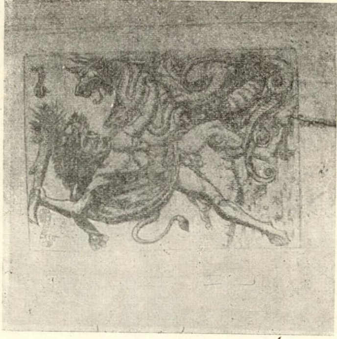
b. A. Pollaiuolo'nun "Herakles ve Hydra" adlı tablosunun kopyası