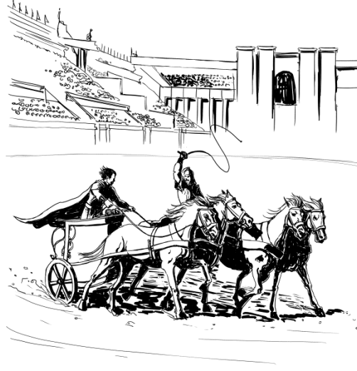
Şekil 2. Hipodrom(Kaynak: Akarsu, 2012 :122 ,İllüstrasyon: Devrim Kunter)

Prinkipo (Büyükada): Prens Adaları'nın Bizans'ın sürgün yeri olduğunu bilinmektedir. Taç kavgalarından yenik düşmüş, kaybeden tarafta yer almış, mağlup olmuş ya da başka bir şekilde gözden düşmüş, o nedenle gözlerine mil çekilmiş Bizans soylularının, prenslerinin ve generallerinin acılar içinde ölmeleri için gönderildikleri mekândı söz konusu adalar. (Akarsu, 2012: 7-11)