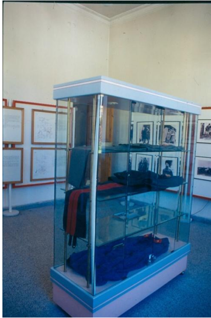
Şekil 10: Zafer Müzesi General İsmet İnönü Odasından Görünüş