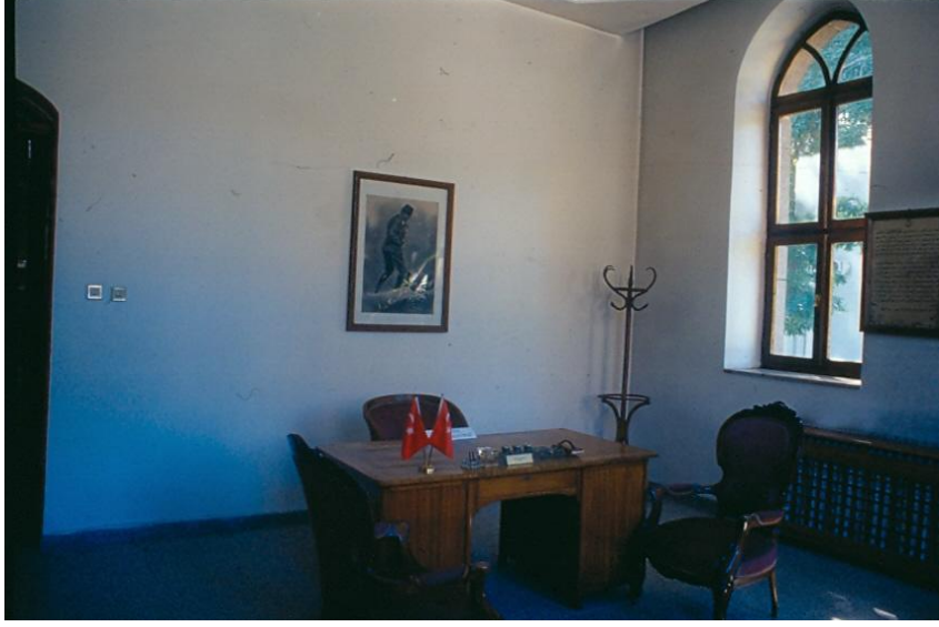
Şekil 7: Zafer Müzesi Atatürk Odasının Görünüşü