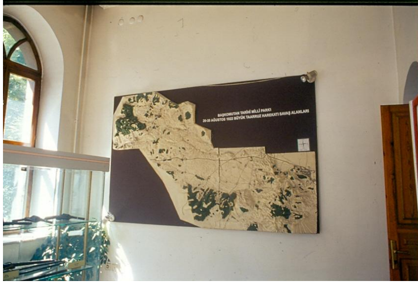
Şekil 9: Zafer Müzesi Mareşal Fevzi Çakmak Odası