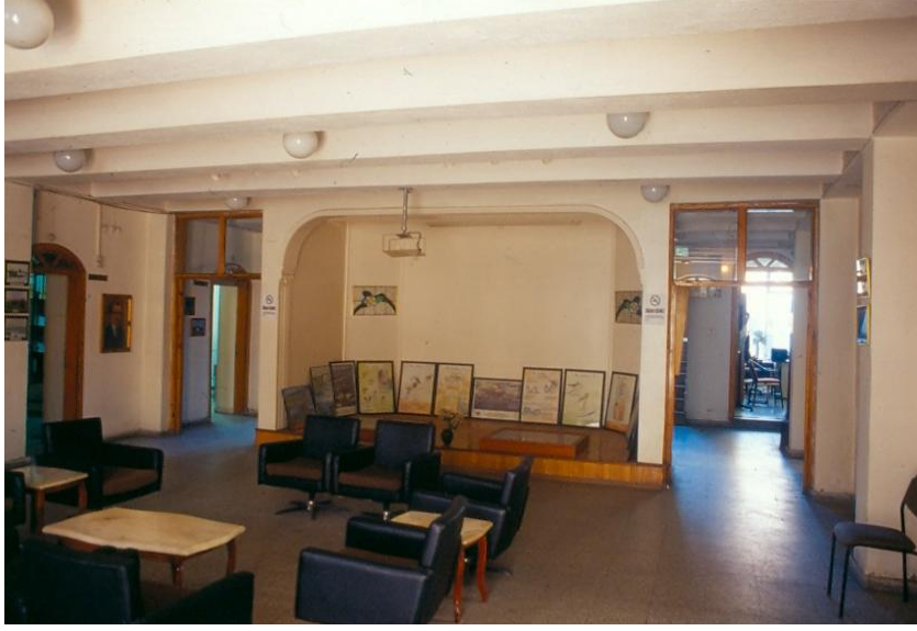
Şekil 5: Zafer Müzesi Zemin Kat Holünden Görünüş

K. İnce / NEÜ Sosyal Bilimler Enstitüsü Dergisi 1 (2011) 254-267 K. İnce / Nevsehir University Journal of Social Sciences 1 (2011) 254-267