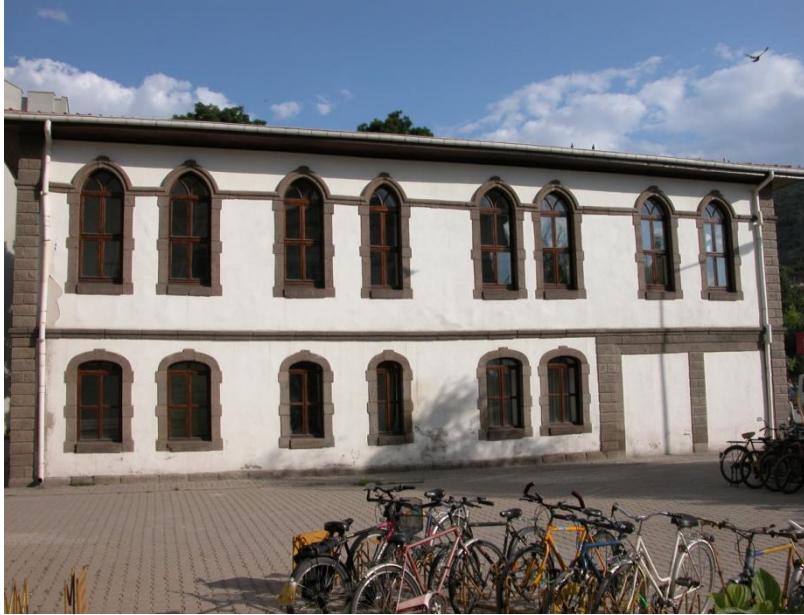
Şekil 2: Zafer Müzesi Kuzey Cephesi