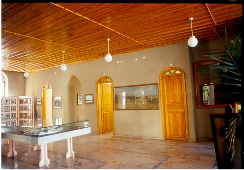
Şekil 8: Zafer Müzesi Birinci Kat Güneyi Odaları