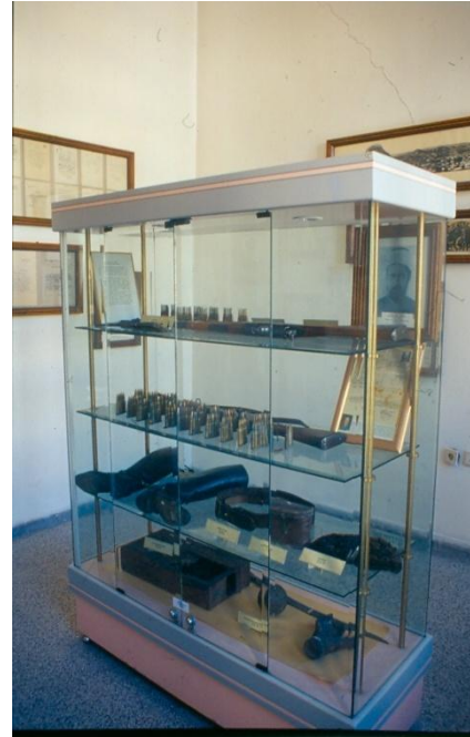
Şekil 11: Zafer Müzesi Afyonkarahisar-Dumlupınar-Zafer Tepe-Çalköy Odasından Bir Görünüş