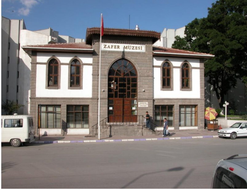
Şekil 1: Zafer Müzesi Ana Girişinin Görünüşü

K. İnce / NEÜ Sosyal Bilimler Enstitüsü Dergisi 1 (2011) 254-267 K. İnce / Nevşehir University Journal of Social Sciences 1 (2011) 254-267