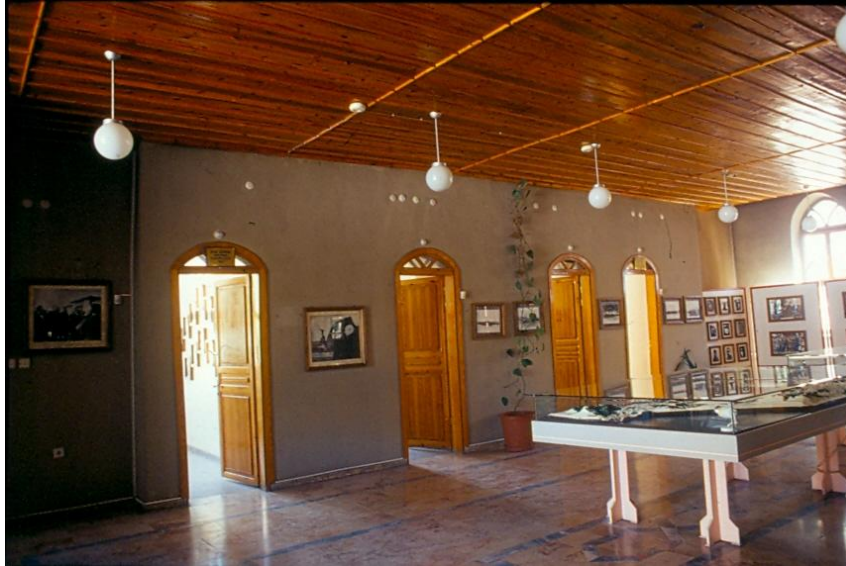
Şekil 6: Zafer Müzesi Birinci Kat Holünden Görünüş