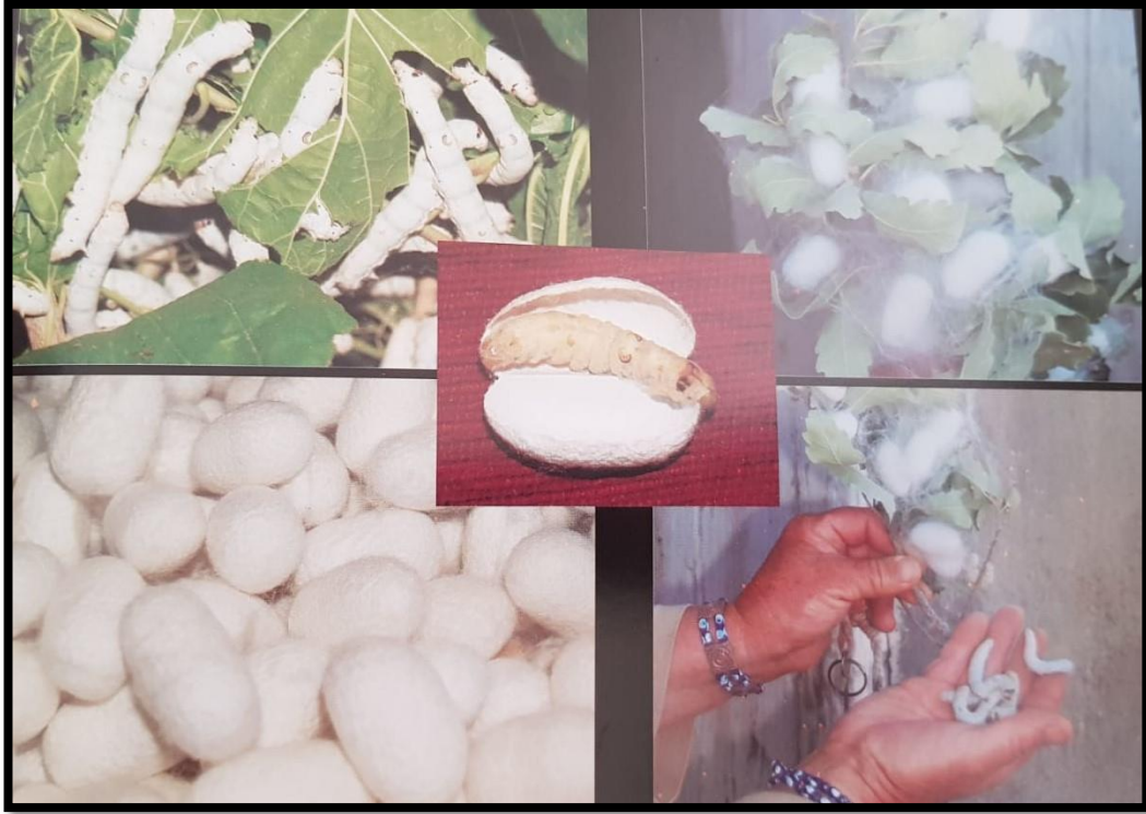
Fotoğraf 2: Kulp'ta ipek böcekçiliği

Diyarbakır'da dokuma tarihi, Ergani Çayönü, Bismil Körtiktepe gibi tarihsel yerleşimlere dayanmaktadır. Bu antik yerleşmelerde yapılan arkeolojik incelemeler sırasında Ergani Çayönü'nde M.Ö. 7000'li yıllara tarihlenen kumaş parçası tespit edilmiş olup bu kalıntı bilinen en eski dokuma örneğidir (İzady, 2004:436). Ayrıca dokuma kalıntılarında Körtiktepe kazılarında da rastlanmıştır (Doru, 2013:294). İnalçık'a göre Diyarbakır geçmişte kırmızı iplik sanayiinin eski merkezi idi (İnalçık, 1996:63). Diyarbakır kırmızısı, Diyarbakır chafarcanisi (Diyarbakır charfarcanileri, kırmızı veya menekşe zemin üzerinde çiçeklerle süslenmiştir) olarak da adlandırılan dokuma ürününün boyama teknolojisi Avrupalılara ilham kaynağı olmuş ve başka bir ifade ile pamuklu dokuma çeşitlerinin boyama teknolojisini Diyarbakır üzerinden öğrenmişlerdir (İnalçık, 2015:114). Diyarbakır'da Osmanlı kara ordusu ve donanması için üretimi yapılan bir tür kumaş olan Kirpas ise en önemli dokuma malzemelerinin başında gelmektedir. Yılmazçelik (1995:313)'de kentin kirpas üretimi ile ilgili önemli istatistikler vermekte, 1793-1817 tarihleri arasındaki üretimin yıllık 10.000 top ile 20.000 top arasında gerçekleştiğini vurgulamaktadır.