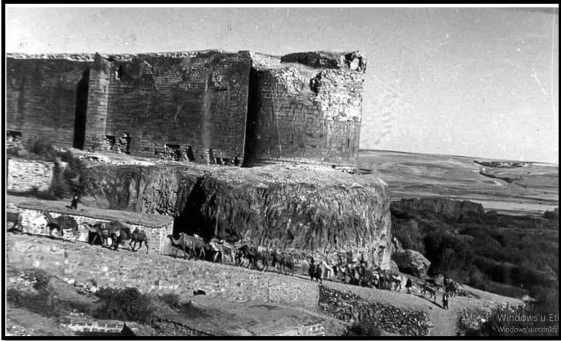
Fotoğraf.3. Mardin Kapıdan Diyarbakır'a giriş yapan bir kervan (URL 1)

Cumhuriyet'in ilk yıllarında Diyarbakır'da Atatürk tarafından bir at damızlık merkezinin kurulduğunu (Atatürk 1928 yılında Dicle kenarında 1000 dönümlük arazi aldirıp 32 atlık aygır deposu yaptırmıştır), iyi cins at yetiştirmek için İran ve Irak'tan bazı at cinslerinin yetiştirilmek üzere kente getirildiği belirtilmektedir (Haspolat, 2013: 382, Alan, 2010:72). Bir süre sonra at yetiştiriciliği için açılan damızlık merkezinden vazgeçilmiştir. Diyarbakır'da teknolojik gelişmelere paralellik gösteren ulaşım araçlarındaki ilerlemeler, atçılık faaliyetini fonksiyonlarını sınırlandırarak sadece yarışlarda kullanılan bir nesne haline getirilmiştir. 1927'den başlanarak kentte at yarışları düzenlenmiş, kentin farklı mahallelerinde düzenlenen yarışlar Koşuyolu Parkı olarak da bilinen alanda uzun yıllar yapılmıştır. Günümüzde de (2009 yılında) Çınar ilçesi yolunun üzerinde bir hipodrom yapımı tamamlanarak at yarışı için uygun bir alan oluşturulmuştur (Alan, 2010:73).