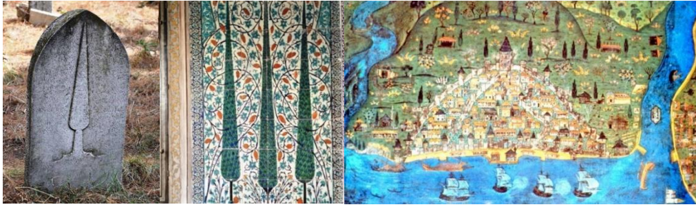
Resim 2: Mezar taşı, çini (Topkapı Sarayı Harem Dairesi), minyatür örnekleri (Matrakçı Nasuh Galata minyatürü) (Tosun, 2016; Anonim 2020d; Ortaylı, 1996: 304)