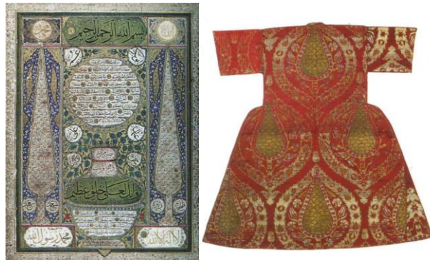
Resim 3: Servi motifli tezhip (Kankal, 2006: 57) ve çocuk şehzade kaftanı (Cebeci, 2019: 60)

Türk kültüründe önemli bir yeri bulunan servinin görseelliği şiire de yansımıştır. Servi; şiirde fiziksel özellikleri ve sembolik anlamlarının yanında şiirin yazılış formu şeklinde de kullanılmıştır. Sâdıkî'nin servi ağacı şeklinde kaleme aldığı şiiri (Şenödeyici, 2012: 89) bu hususta dikkat çekicidir: