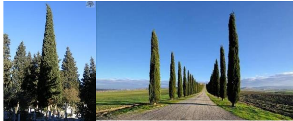
Resim 1: Piramit formu Akdeniz servisi (Anonim 2020c; Torlak, 2013)

Akdeniz servisinin ülkemizde doğal yetişen iki varyetesi bulunmaktadır. Bunlar, dalları dik olan Cupressus sempervirens var. pyramidalis ve dalları yatay gelişen Cupressus sempervirens var. horizontalis 'tir. Türk kültüründe kendine daha fazla yer edinen servi varyetesi ise dalları dik olan Cupressus sempervirens var. pyramidalis , yani piramit formu servidir (Resim 1). Piramit formu servi; ehrami servi, kara servi ya da mezarlık servisi olarak da adlandırılmaktadır. Türkiye'de Güney ve Batı Anadolu'da denize yakın bölgelerde yetişmektedir (Çağlar, 2003: 66). Koyu yeşil bir görünüme sahip olan piramit formu servi, daha çok park ve bahçelerde, mezarlıklarda ve kırsal alanlarda yol kenarlarında kullanılmaktadır (Torlak, 2013).