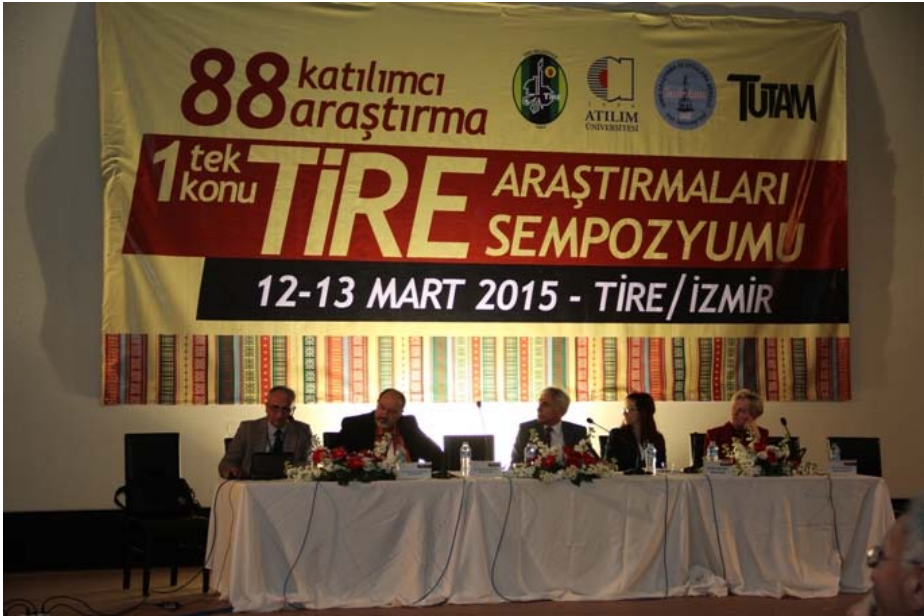
Tire Sempozyumundan bir görüntü