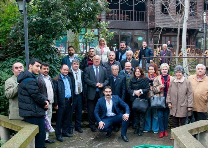
Tire Arařtırmaları Sempozyumu'ndan Bir Fotoğraf, 14 Mart 2015, Derekahve Cafe, Tire.