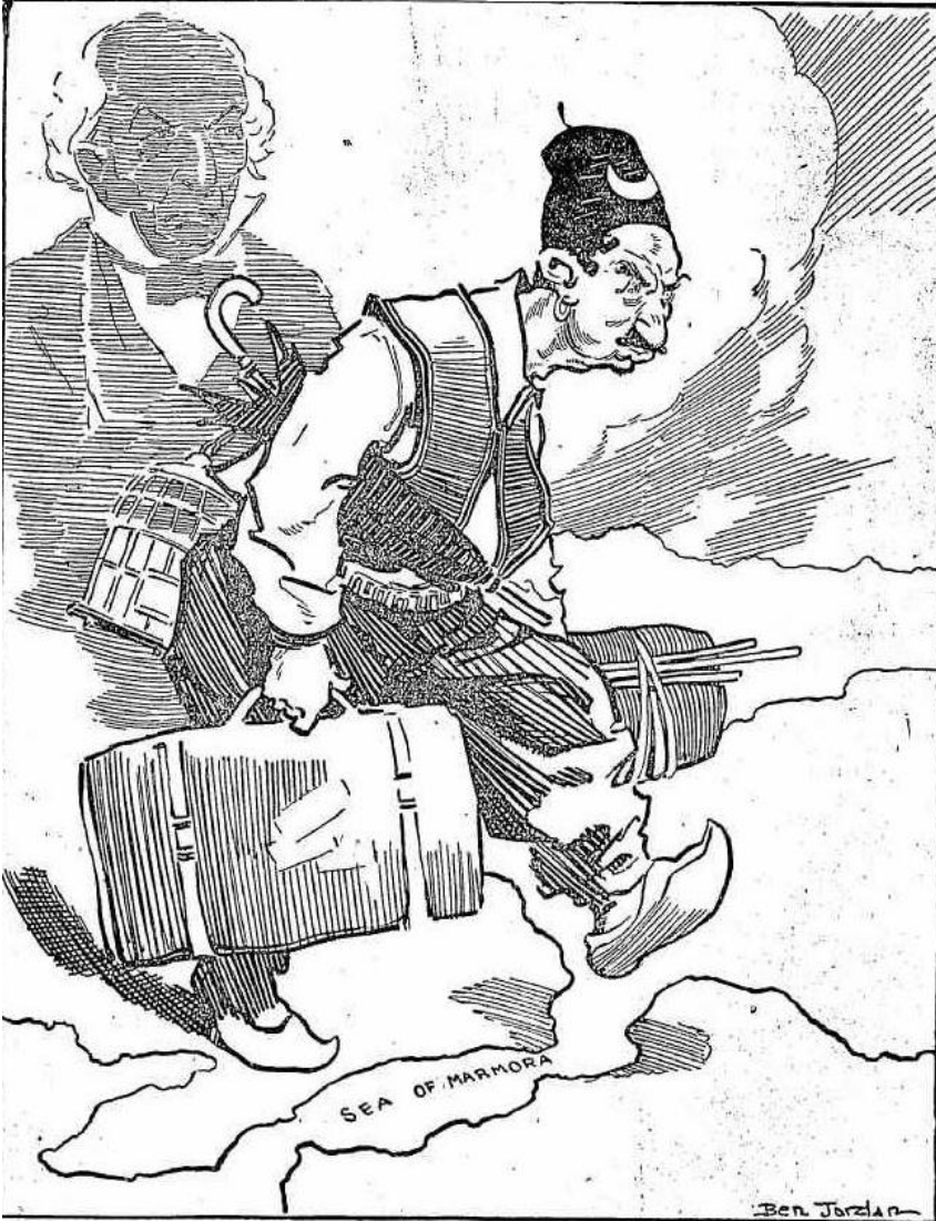
The occupation of Smyrna by the Greeks affords a further reminder of the fact that one of the most notable results of the war will be the virtual driving of the Turk "bag and baggage" (in Gladstone's phrase) from the East.