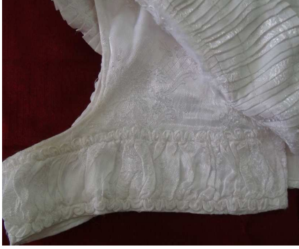
Fotoğraf 17: Yelek Detayı 3 120-130 Yıllık